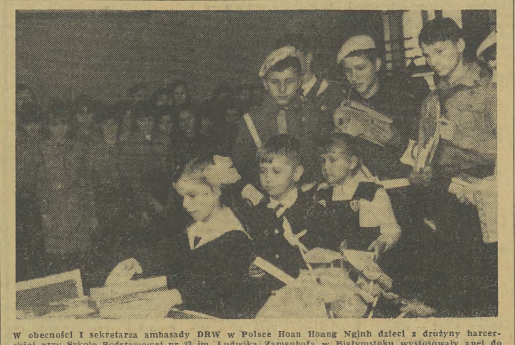
W obecności I sekretarza ambasady DRW w Polsce Hoan Hoang Nghin dzieci z drużyny harcerskiej przy Szkole Podstawowej nr 23 im. Ludwika Zamenhola w Białymstoku wystosowały apel do młodzieży z całej Polski w sprawie zbierania podarunków noworocznych dla dzieci wietnamskich. Młodzież szkoły zapoczątkowała już zbiórki upominków noworocznych. Płynące ze szczerego serca dary dzieci białostockich mają stanowić dowód więzi dzieci polskich z wietnamskimi. Apel podjęły też inne szkoły w Polsce. Na zdjęciu: dzieci ze Szkoły nr 23 składają podarki.

Dzisiaj doradca prawny „Gazety” udziela porad telefonicznie w godz. 13-14.30, osobście godz. 14.30-17.