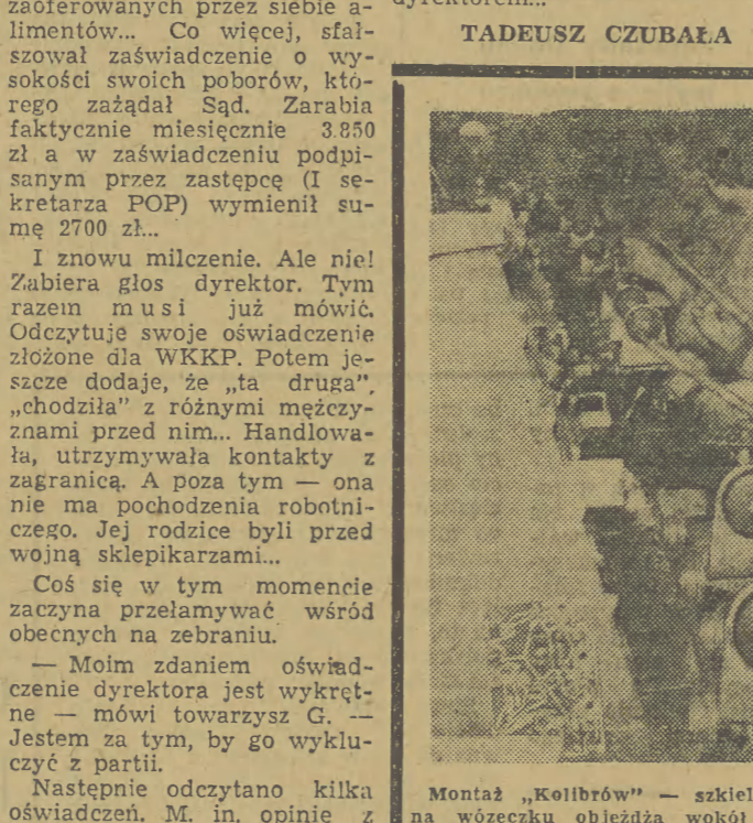
Montaż „Kollbrów” — szkielec radiolodobornika umieszczony na wózeczku objeżdża wokół linii montażową obrabując w podzespoły.