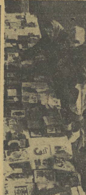
Liczni klienci estetycznej i przestronnej kawiarni „Dobry Książki” przy nowobudowanym Placu Centralnym...