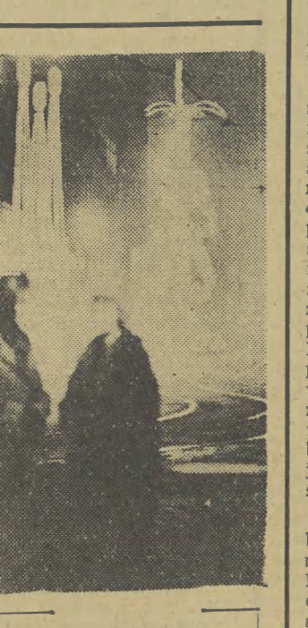
POZNAN NOCA Pomysłowe reklamy neo- nowe nadają poznańskim ulicom wielokierunkowy charakter.

Nowym artykułem polskiego eksportu do Ghany jest mydło. Ostatnio zawarłmy kontrakt na dostawę do tego kraju 1.200 ton mydła wartości 750 tys. zł dewizowych.