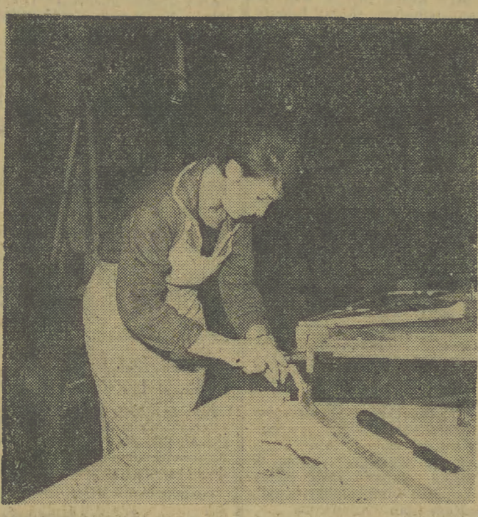
Już 9 lat istnieje w Kallazu Technikum Budowy Fortepianów kształcące fachowców dla miejscowej Fabryki Pianin i Fortepianów „Callisa”. Codzienne zajęcia praktyczne w warsztatach fabrycznych umożliwiają młodzieży poznanie tajników budowy instrumentów.

W środę zakończyła się w Colombo trzydniowa konferencja szefów państw niezaangażowanych — Birmy, Ceylonu, Ghanu, Indonezji, Kambodży i ZRA poświęcona sprawie granicznego konfliktu chińsko-indyjskiego. Odczytano na końcowym posiedzeniu komunikat stwierdzający, że uczestnicy konferencji zgodzili się na propozycję doprowadzenia do rokowań między ChRL i Indią. Ze względu na dobro sprawy treść propozycji nie będzie na razie ujawniona.