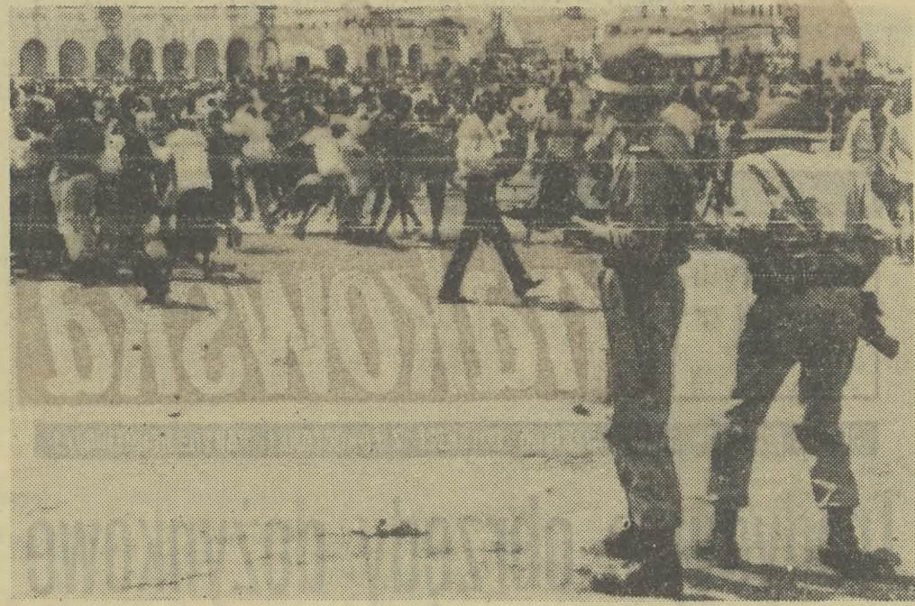
Wkrótce po przybyciu prezydenta de Gaulle'a do Dżibuti, na ulicach francuskiego Somali wybuchły zamieszki. Policja i oddziały Legii Cudzoziemskiej szybko jednak zepchnęły demonstrantów, domagających się natychmiastowego przyznania całkowitej niepodległości temu terytorium, z trasy przejazdu generała. Prasa światowa podkreśla, że demonstracja nie była wymierzona przeciwko samemu prezydentowi de Gaulle'owi. Na zdjęciu: fragment interwencji policji na ulicach Dżibuti.

Turyści przybywający do Drezn najchętniej szukają odpoczynku po zwiedzeniu słynnej galerii malarstwa - na bulwarach miejskich nad Łabą. Po rzece kursują stateczki spacerowe, które w ciągu letnich miesięcy zawsze są pełne chętnych do wodnego spaceru... Na zdjęciu: na przestronnym rzeźniczym porcie w Dreźnie.