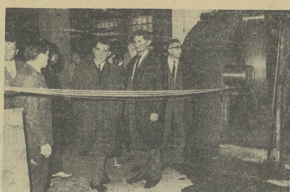
Delegacja Komitetu Obw. KP Ukrainy zwiedza od- dział kaprolaktamu w za- kładach Azotowych w Tar- nowie.