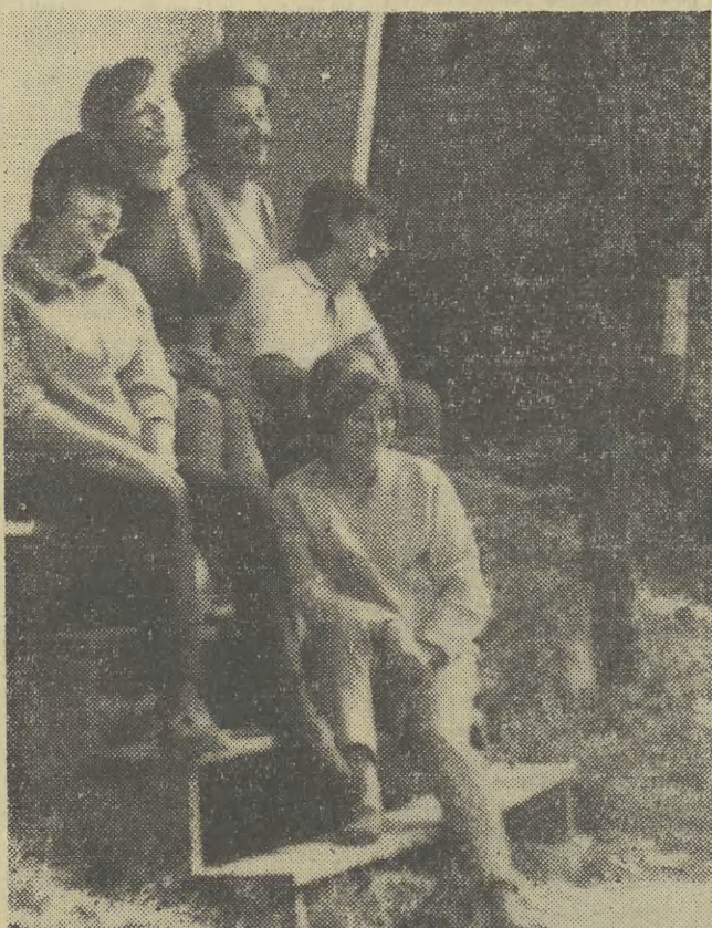
Grupa uczestników obozu dla maturzystów (do informa- cji powyżej).