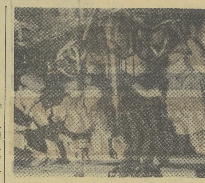
Naród wietnamski mobilizuje sily dla przezwyciężenia trudności wywołanych pirackimi nalotami amerykańskich samolotów. Pracownicy zakładów naprawy silników Diesla Tran Hung Dao w Hanoi już 24 sierpnia wykonali w całości sierpniowy plan naprawy i remontu silników.

NOWY JORK (PAP) W Lauderdale (Floryda) doszło w środę wieczorem po raz drugi z rzędu do starć między młodymi Murzynami a policją. Około 75 Murzynów zgromadziło się przed restauracją. Gdy policja kawała im rozproszyć się, gwałtownie na to zareagowali. Dwóch uczestników starć aresztowano. Z podobnych powodów w tej dzielnicy miasta wydarzyły się zajścia w środę, przy czym aresztowano wówczas 9 osób.