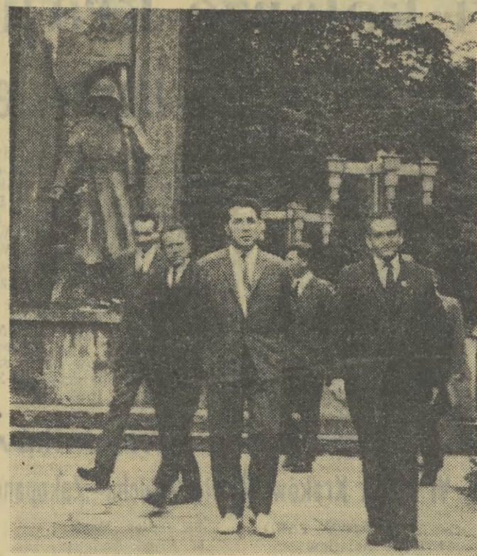
Goście z Kijowa przy Grobach Żołnierzy Radzieckich koło Barbakanu.