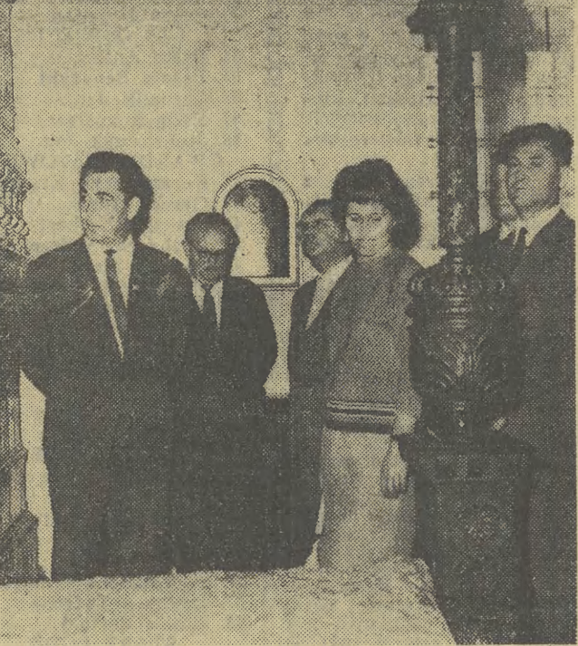
Halo - tu Gródek nad Dunajcem

Lody znowu stały się przyczyną masowego zatrucia. W Kamięcu Zapkowickim na Dolnym Śląsku lodami pochodzącymi z miejscowej kawiarni GS zatrulono około 250 osób. Ponad 130 osób przewieziono do szpitali. Na szczęście dzięki szybkiej akcji ratunkowej większość chorych powróciła już do domów, a stan zdrowia pozostałych nie budzi również obaw.