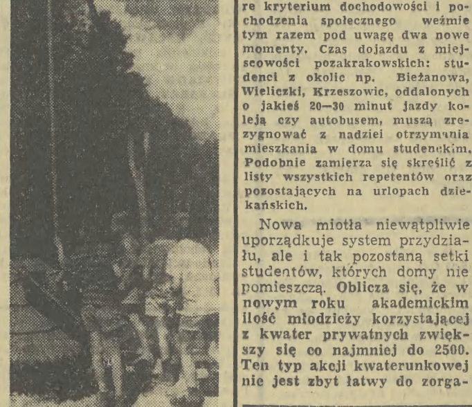
Muzeum skansenowskie w Zubrzycy Górnej zwiędziają rok roczne liczne rzesze turystów.