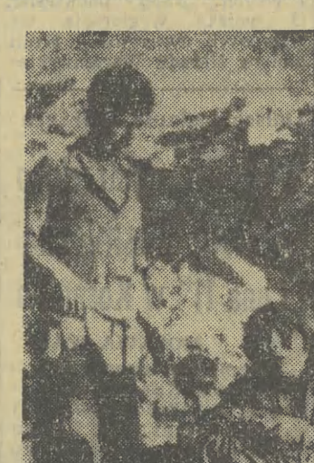
W tureckim mieście Varo, które padło ofiarą katastrofalnego trzęsienia ziemi, w dalszym ciągu ekipy ratownicze wyłęgają spod gruzów zwłoki ofiar kataklizmu.

W środę podano oficjalnie do wiadomości, że odwołano wprowadzenie na orbitę 8 amerykańskich sztucznych satelitów, które miały usprawnić łączność radiową między Pentagonem a dowództwem wojsk amerykańskich w Wietnamie południowym.