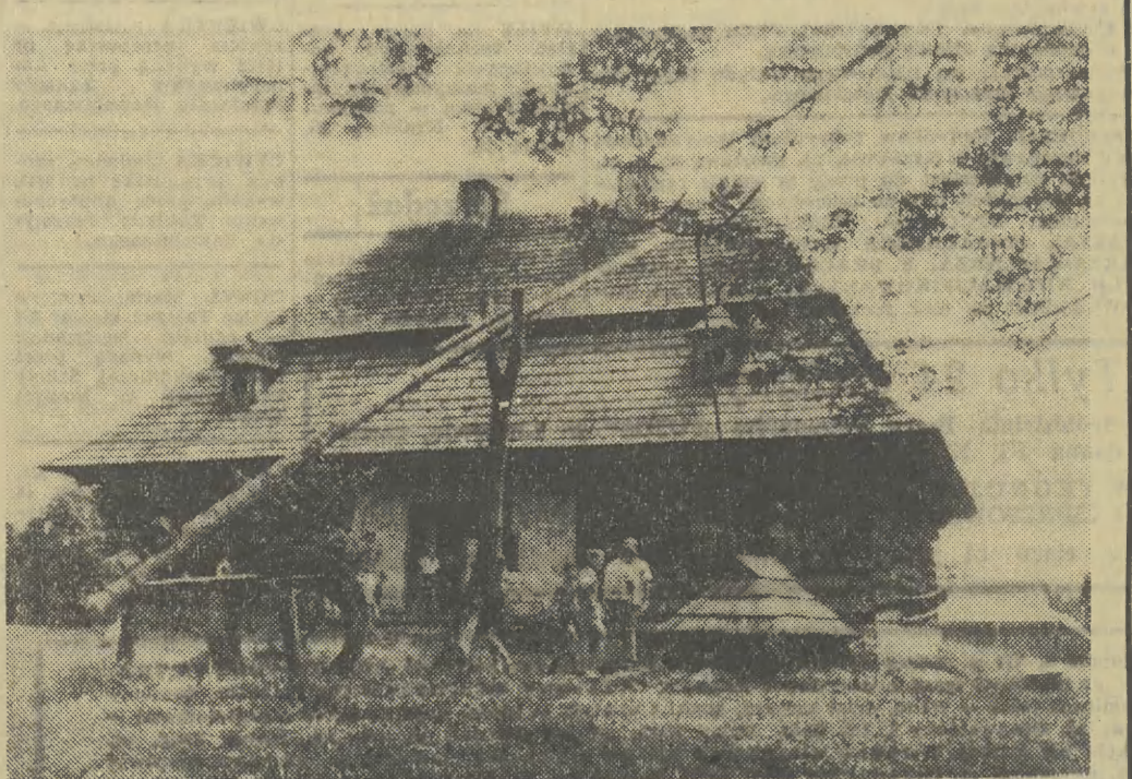
W zabytkowej chacie obok muzeum w Zubrzycy Górnej mieści się schronisko turystyczne.