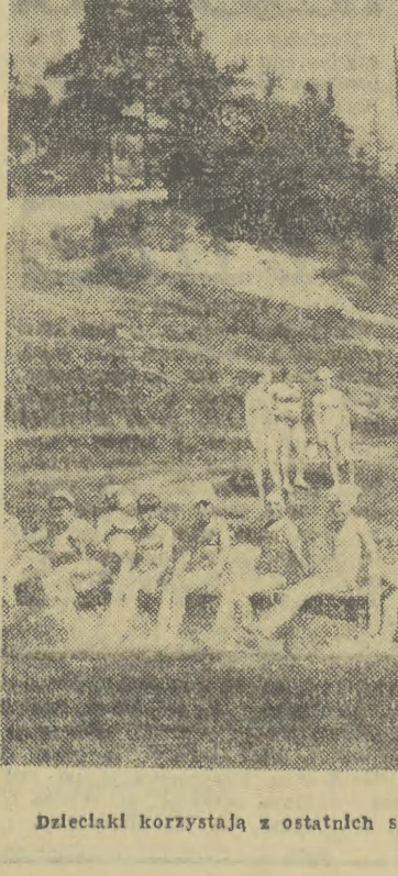
Dzieciaki korzystają z ostatnich słonecznych dni na kolonijach.