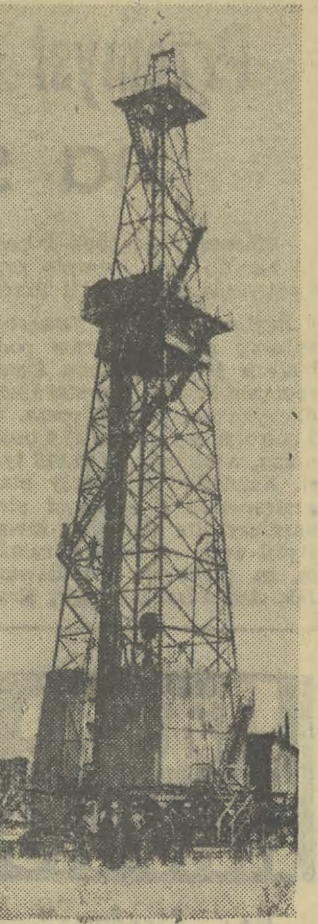
Jastelscy wiertnicy odwierdili ostatnio wysokowydajny szyb, z którego wypływa ropa samoczynnie.

Kupić, sprzedać, zarobić. Kupić maszynę do wyrobu potrzebnego towaru, sprzedać ten towar, no i oczywiście zarobić na całej operacji. Operacjom takim, jak najbardziej pobogostawionym przez państwo, na imię — inwestycje szybko rentujące się. Cóż za wspaniałe pole do poruszenia dla inicjatywy, rzutkości, obrotności i wszystkich innych pryncypów znanonijęcych ludzi interesu. Ale interesu społecznie użytecznego: dla producenta i rynku. Pieniądze? Wystarczy rzetelnie skalkulować czy gra warta świeczki i ad hoc poniesione wydatki szybko i z nawiązką się zwrócą. Jeśli tak, otworzył zakładowy fundusz inwestycyjno-rentowy. Nie wystarczy to, do usług śpieszy bank z ofertą kredytu. Wszystko poza planem, bez przejmowania się limitami, wskaźnikami itp. I w tym momencie wielu odważnych zaczyna tracić pewność siebie. Kredyt może iść nawet w miliony złotych, ale w ciągu trzech lat musi być w całości zwrócony. Tyłko o wykorzystanie go na produkcję eksportową daje prawo do zwrotu w ciągu lat pięciu. Dopóki można korzystać z dotacji państwowych wszyscy śmiało wyciągają rekę. Powszechny pęd do inwestowania zawsze wykazywał apetyty grubo ponad stan kasy państwowej. A tu na odwrót. Bank czeka, a chętnych mniej niż pię-