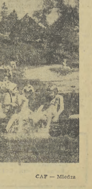
Dzieciaki korzystają z ostatnich słonecznych dni na kolonijach.