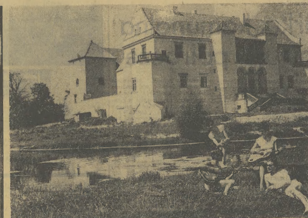
Jednym z zabytków Szydłowca (woj. kielecki) jest XVII wieczny zamek. Po wojnie był on w stanie kompletnej ruiny. Obecnie został odbudowany i przeznaczony na dom kultury oraz oddział Muzeum Świętokrzyskiego.