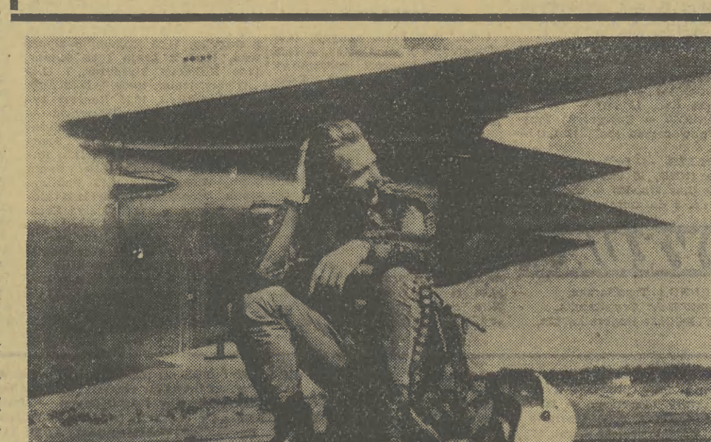
Pilot i jego maszyna.

Wskorzysta treści ideowo-wychowawcze Szkolnictwo, w tym również krakowskie, zdaje sobie sprawę z konieczności pogłębienia pracy ideowej z młodzieżą, wzmożenia roli nauczyciela jako wychowawcy. Po majowym plenum KW PZPR w szkołach obradowały szkolne organizacje partyjne, w niektórych powoli zaczęły się organizować narady nauczycieli — członków partii, w Nowej Hucie obradował wojewódzki sejmik oświatowy. Na wszystkich tych spotkaniach o realizacji uchwały plenum mówiono w nawiązaniu do aktualnej sytuacji szkoły, łącząc to z przegotowaniami do nowego roku szkolnego 1966/67, który będzie ostatnim etapem wprowadzania reformy szkolnictwa podstawowego, w którym nowe programy i nowe podręczniki znajdują się we wszystkich klasach — od I do VIII. A główne zadanie szkoły i nauczyciela sformułowano następująco: w pełni wykorzystaj treści ideowo-wychowawcze, zawarte w nowych programach szkolnych w materiałach poszczególnych przedmiotów.