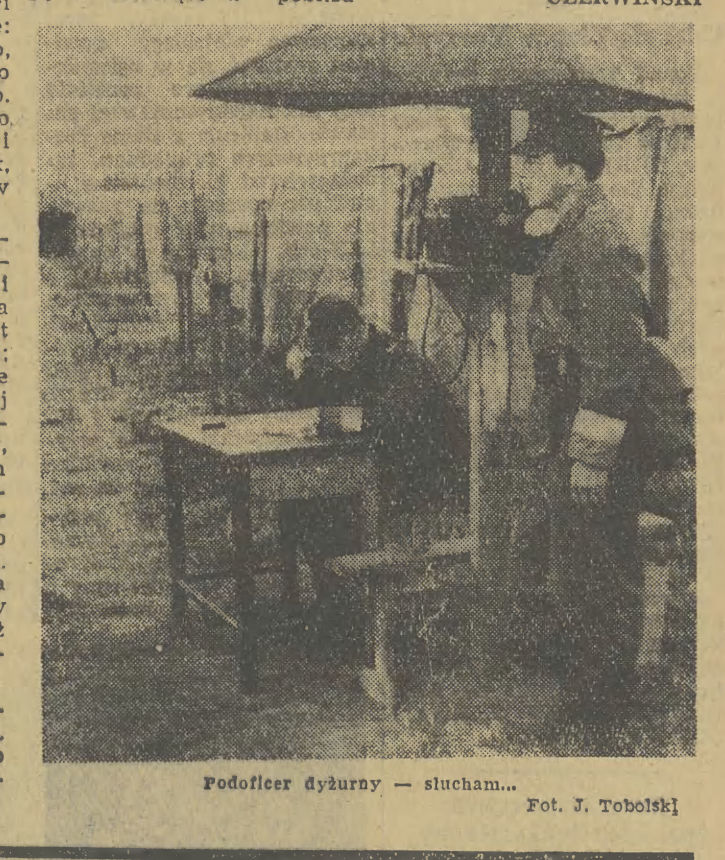
Podoficer dyżurny — słucham...