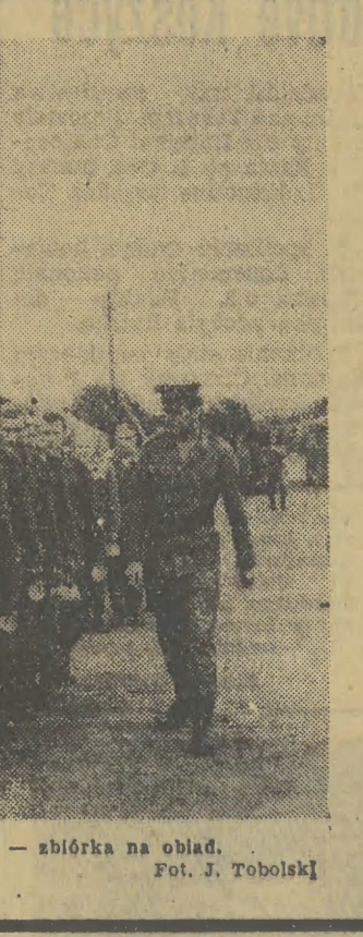
Tej komendy powtarzać nie trzeba: — zbiórka na obiad.

Ale ma się te dwadzieścia lat i przyzwyczajenie do chałbki i niedziela. Kilku dziesięciu studentów przekracza bramy obozu. Legalnie, z przepustkami w kieszeniach. Szef sprawdził umundurowanie, służbowo odnotował w księgach.