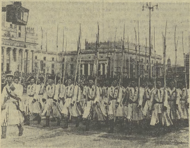
Imponująco prezentowali się krakowscy koszyrzy.

Plac zalany jest potokami słońca. Za trybuną honorową, na wysokich rusztowaniach - wielki Biały Orzeł na tle biało-czerwonej draperii. Po obu stronach trybuny flagi: biało-czerwone, czerwone, zielone i błękitne.