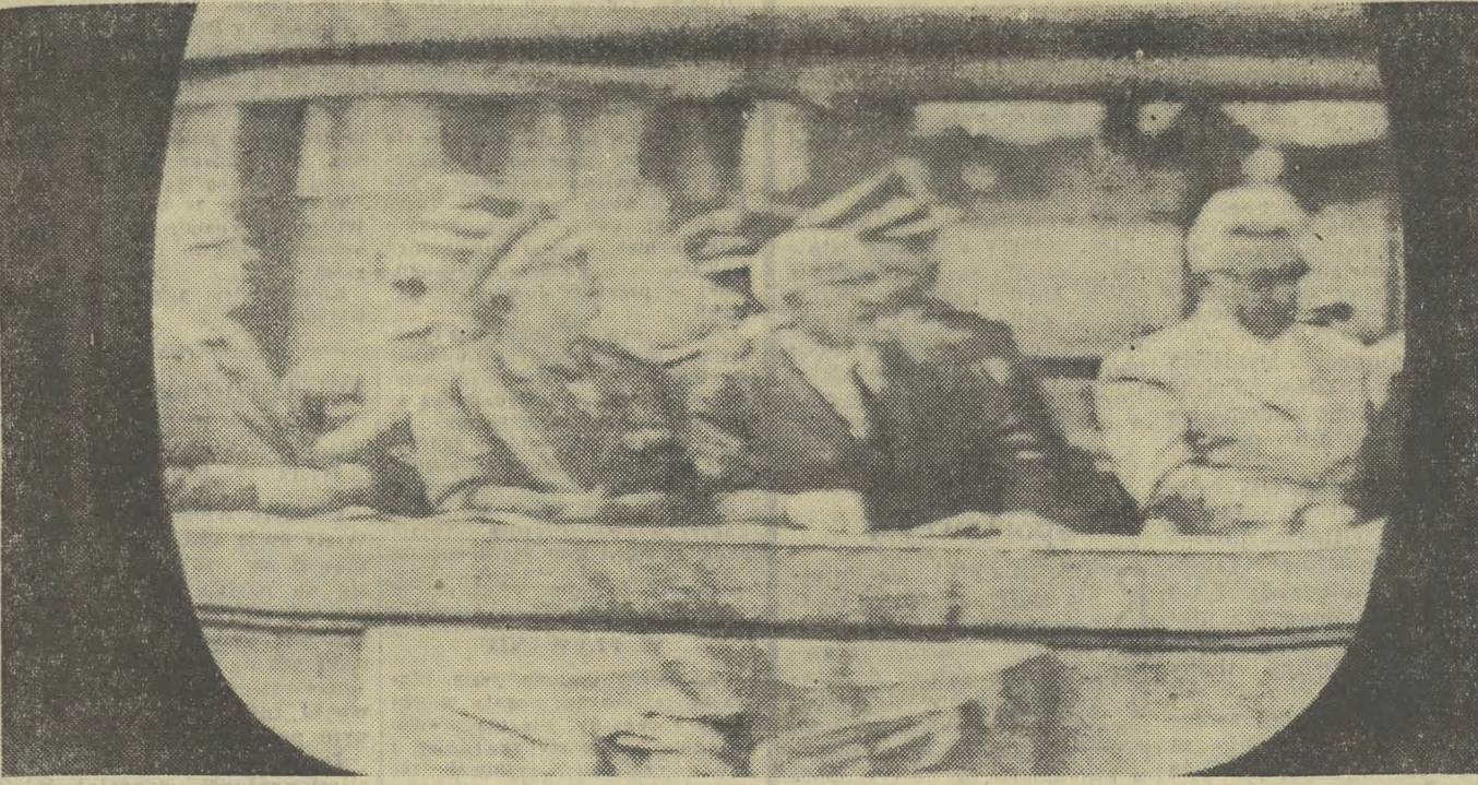
Trybuna honorowa: od lewej - Józef Cyrankiewicz, Marian Spychalski, Władysław Gomułka, Edward Ochab.

WARSZAWA (PAP) 22 LIPCA - Z OKAZJI TYSIĄCLECIA PAŃSTWA POLSKIEGO I ŚWIĘTA ODRODZENIA ODBYŁA SIĘ W STOLICY WIELKA - NAJWIĘKSZA Z DOTYCHCZASOWYCH - DEFILADA WOJSKOWA ORAZ MANIFESTACJA MŁODZIEŻY I PARADA SPORTOWCÓW. NA TRYBUNIE HONOROWEJ OBECNI BYLI CZŁONKOWIE NAJWYŻSZYCH WŁADZ PRL Z WŁADYSŁAWEM GOMUŁKĄ, EDWARDEM OCHABEM I JÓZEFEM CYRANKIEWICZEM, DEFILADĘ POPRZEDZIŁO PRZEMÓWIENIE MARSZAŁKA POLSKI MARIANA SPYCHALSKIEGO.