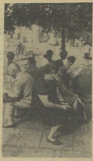
Jeszcze niedawno na placu Wolności stało kilka ławek — ku wypoczynku i zadowoleniu krakowian i turystów. Ale nie spodobało się to komuś, a teraz nie ma gdzie usiąść. Trudno o wypoczynki na jednej, zatoczony do granic możliwości...

Zestaw boisk. Również dla Technikum Mechanicznego budynku w wymiarach 18x9 m lub większych oraz 62 sale zastępcze. Te ostatnie praktycznie rzecz biorąc nie nadają się do eksploatacji; są to po prostu większe sale lekcyjne, z konieczności mające służyć potrzebom wychowania fizycznego. W naszym mieście przy szkołach znajdują się ponadto 115 skoczni lekkoatletycznych, 86 bieżni, 119 boisk do siatkówki, 92 — do piłki ręcznej, 61 — do koszykówki oraz 12 do piłki nożnej.