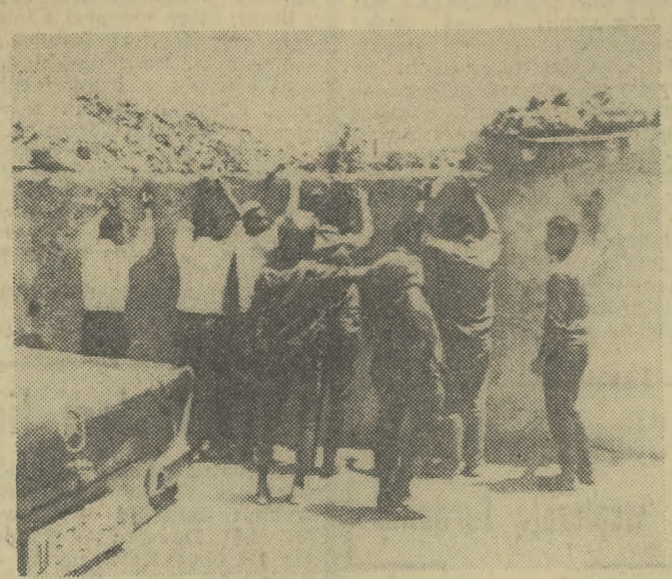
Okupanci izraelscy nadal stosują terror wobec ludności arabskiej zamieszkującej w okolicach Ha-Chodż. Zatrzymywanie i rewidowanie Arabów, aresztowania podejrzanych są na porządku dziennym.

„Al Ahram” wskazuje, że Sadat, który omówił również szeroko sprawę federacji republik arabskich (Libii, Syrii i Egiptu), podkreślił trzy następujące czynniki: • Egipt bierze pod uwagę doświadczenia wynikające z błędów popełnionych podczas dawnej unii syryjsko-egipskiej. • W skład obecnej federacji wchodzi niezależne i potężne państwo. • Federacja nie stanowi ani klanu ani osi skierowanej przeciwko jakemukolwiek państwu arabskiemu i służy do skutecznego wywołania wojny Izraelowi.