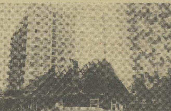
Na starej Krowodrzy znikają ostatnie zaprawy dawnej ulotki podkrakowskiej. Na miejscu domostwa rodziny spokrewnionej z Czepcami — tymi z „Wesela” Wyspiańskiego — już wkrótce powstanie parking.

Borek Fałęcki — przy budowie hotelu (72 miejsca noclegowe) położonego kilkadziesiąt metrów od basenu zastajemy zaledwie kilku robotników. I tu notuje się opóźnienia, które do końca lipca miały być zabetonowane dach, tymczasem do tej pory KPBO „Zetbewu” wykonało połowę pracy. Wykonawcy jednak zobowiązali się wywiązać z ustalonego terminu i ostatecznie przekazać hotel do użytku 31 grudnia. Pole namiotowe w przyszłym roku będzie już mogło przyjąć ok. 105 turystów. (tb)