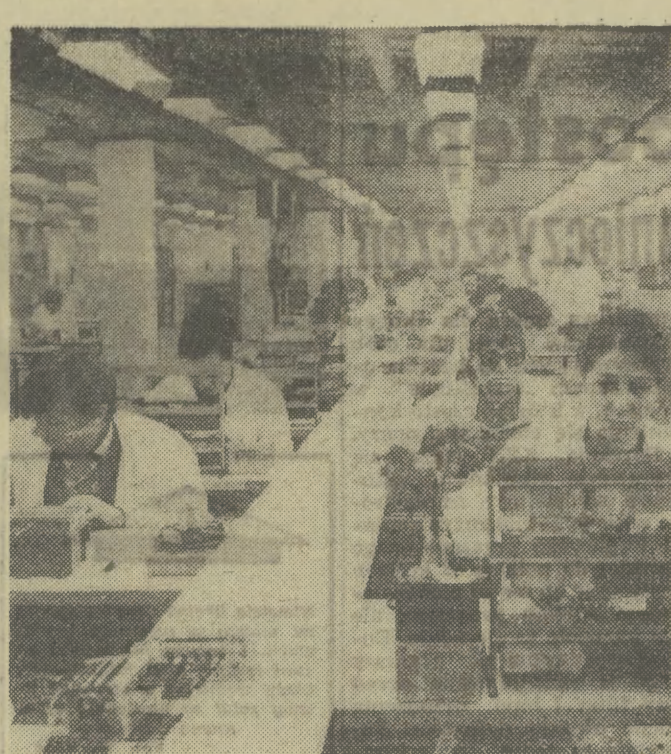
Dzielnia „Diera” przygotowuje się do unowocześnienia produkcji. Plan tegoroczny przewiduje wytworzenie 6 nowych typów radiodiodów. Niestety opóźnienie technologiczne zaskazuje poważnie trudności. Hamulcem są także nierozwiązane w terminie dostawy kooperacji. Zdarzają się wypadki postoju taśm montażowych trwające nawet przez kilka dni. Z impasu produkcyjnego „Diera” nie może wyjść do kilku lat. Czy stan ten zależy wyłącznie od tzw. „przychylnych” obiektywnych?