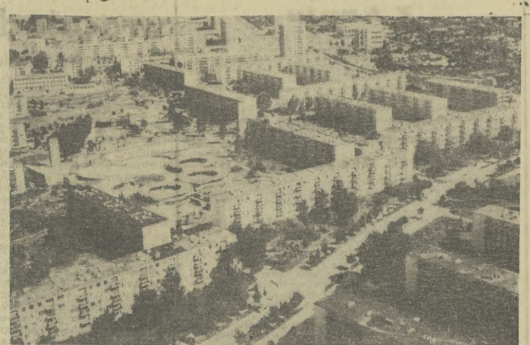
Galacz stał się drugim co do wielkości — po Konstancy — portem rumuńskim, największym w kraju producentem stali i największym ośrodkiem produkcji żelaza i stali. Na zdjęciu: widok z lotu ptaka na nowe osiedle mieszkaniowe Galacza.