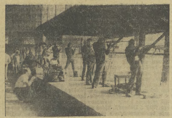
Wczoraj na strzelnicy w Woli Justowskiej rozpoczęły się wojewódzkie i miejskie eliminacje strzeleckie ORMO w konkurencjach kobiecych i męskich. Najlepsi zawodnicy wezmą udział w XIII Centralnych Mistrzostwach Strzeleckich ORMO w Warszawie we wrześniu br. Na zdjęciu: zawodnicy podczas strzelania.