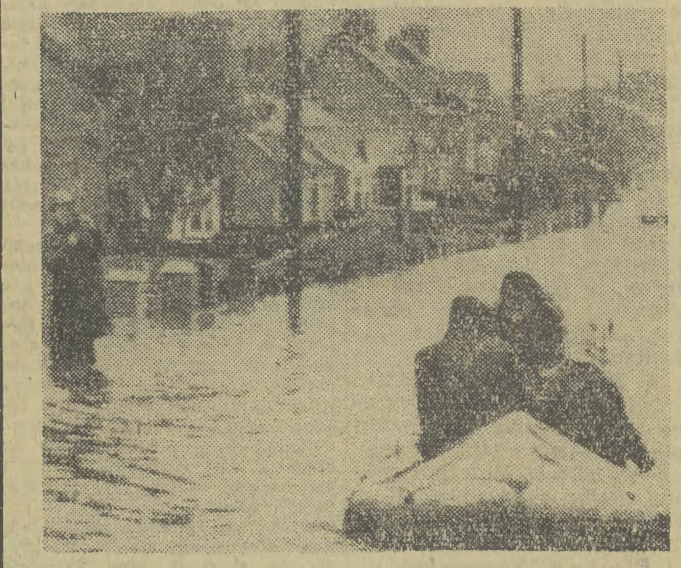
Gwałtowne opady deszczu w północno-wschodniej Anglii spowodowały powódzie w wielu miejscowościach tego rejonu. Na zdjeciu: zalane wody ulice miasteczka Dalton.