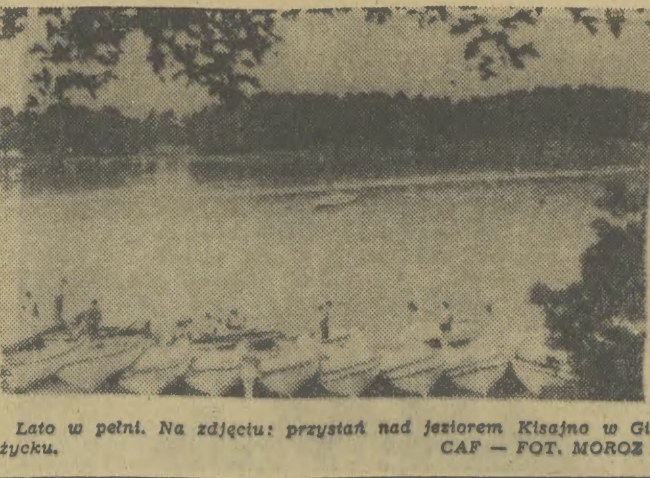
Lato w pełni. Na zdjęciu: przystań nad Jeziorem Kisajno w Giżycku.

Cieszy ten eksperyment. Ale czy nie powinien być wprowadzony w życie lat temu... naniecie?