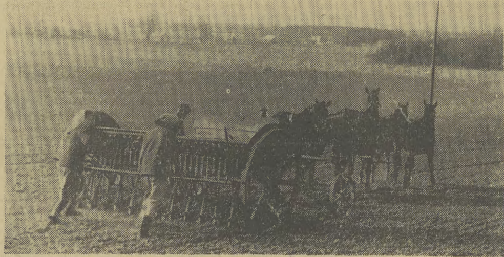
W kilku „cieplejszych” powiatach naszego województwa rozpoczęto już siewy wiosenne, m. in. w powiecie bocheńskim, brzeskim i tarnowskim.

Peruwiański chłopczyk nosi z sobą butelkę z wodą, która w wielu rejonach kraju stanowi niezwykłą cenę plyn. W Limie tylko trzy razy w tygodniu pracuje miejski wodociąg...