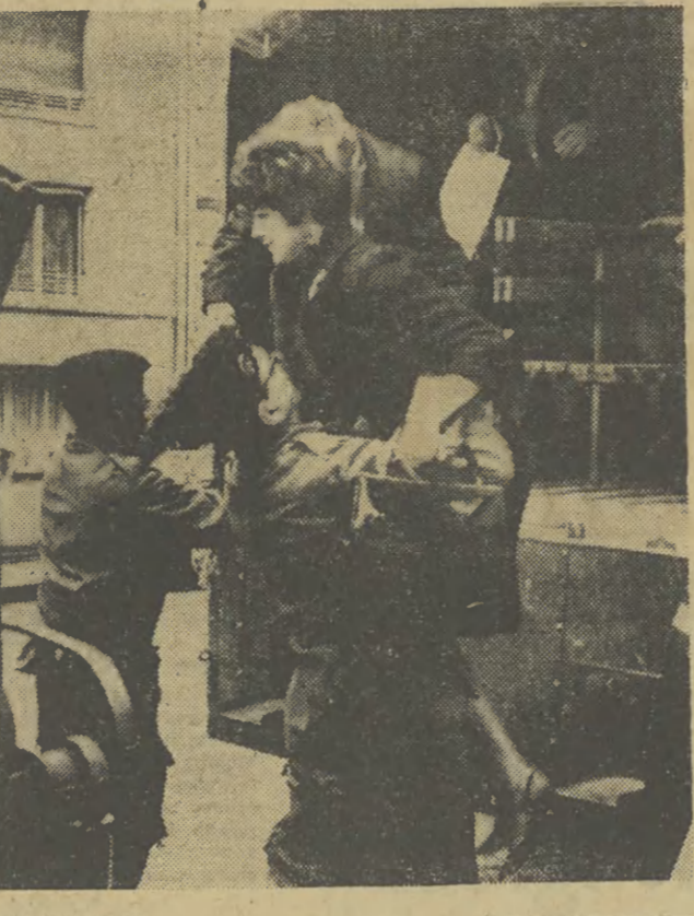
Strajk pracowników elektrowni paryskich sparaliżował życie w stolicy Francji. Z braku prądu stanęło metro a pomoc w komunikacji musiały specjalnie sprowadzone wojskowe ciężarówki. Na zdjęciu: żołnierze pomagają pasażerom wojskowych ciężarówek.