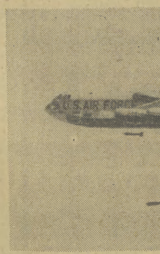
Kilka tysięcy kilometrów przeleciał ten amerykański bombowiec typu B-52, który wystartował z wyspy Guam na Pacyfiku, by przynieść śmierć północnowietnamskiej wiosce na terenach wyzwolonych przez partyzantów. Te pirackie naloty, nie oszczędzające również terytorium Demokratycznej Republiki Wietnamu, agresorzy amerykańscy rozpoczęli w czerwcu ubiegłego roku. Na obecnym etapie eskalacji wojny rajdy ciężkich bombowców B-52 z wyspy Guam są codziennym zjawiskiem na wietnamskim niebie.