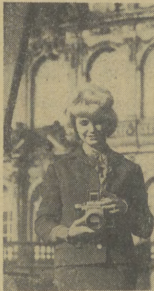
Wiosna — rozpoczął się sezon fotograficzny