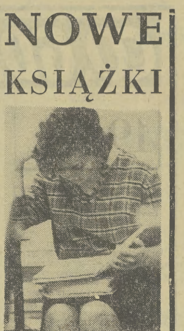
Historia Wanda Kiedrzyńska - RAVENSBRUCK

Wanda Kiedrzyńska - RAVENSBRUCK - kobylcy obóz koncentracyjny, Wyd. Książka i Wiedza, str. 489, cena 40 zł.