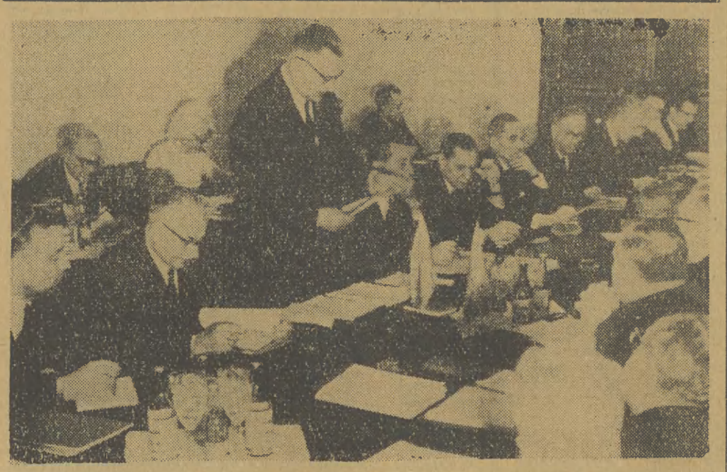
Dnia 20 bm. udala się do Moskwy polska rządowa delegacja gospodarza celem wzięcia udziału w III sesji miedzyrządowej polsko-radzieckiej komisji współpracy gospodarczej i naukowo-technicznej. Delegacji przewodniczy wiceprezes Rady Ministrów - Piotr Jaroszewicz. Na zdjęciu: w sali posiedzeń Wielkiego Pałacu Kremlońskiego przemawia przewodniczący delegacji polskiej - Piotr Jaroszewicz.

Toteż nie kłopotowali się. Teraz zdają z tego rachunek. Nie tylko przed sądem... (z)