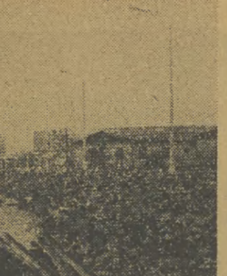
Przystąpiono już do prac przy budowie nowej linii tramwajowej, która połączy Kraków z Nową Huta. Trwają w tej chwili roboty na ul. Nowogrodzkiej. Należy wykorzystać sprzyjającą aurę i kontynuować prace.

Godz. 16.30 Program dnia, 16.35 „Skryżowanie dróg”, 16.55 Wiadomości, 17.00 „Opowieść z przeszłości”, 17.15 „Zrobimy to sami”, 17.30 „Nie tylko dla pań”, 17.55 Tel. Mag. Dem. 18.25 „W kramie opery”, 18.55 „Mysimy tam byli” — pr. ekon., 19.20 Dobranoc, 19.30 Dziennik, 20.00 „Wieczór z Musilmanem Magomajewem” — film, 20.15 „Nowe sztuki Menandra” — pr. hist., 20.40 „Na tropie polkiantów” — film ang. od 16 lat, 22.40 Dziennik.