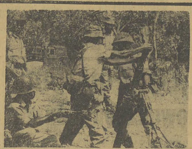
Zołnierze armii zambijskiej pozostają w pogotowiu na wypadek agresji rodujskiej. Na zdjęciu: ćwiczenia z moździerzem 81 mm.