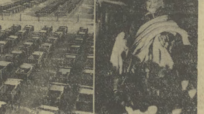
Na fermie zwierząt futerkowych w estońskim kolchozie im. Vilde'a prowadzi się hodowlę norek i lisów, których jest tam 11.400 sztuk. Największą chłubą kolchozu są szczególnie poszukiwane na rynkach światowych i przynoszące największy dochód — niebieskie lisy. Na zdjęciu: od lewej do prawej — norka, widok ogólny fermy hodowlanej w kolchozie im. Vilde'a i jedna z pracowni fermy, Małe Onga z naręczem lisich skórek.

Tylko najwybitniejszym światowym potajemnym chemikiem udało się dotychczas uzyskać „trzy dziewiątki”. Sukces „Oświęcimia” ma wpływ także na nasz eksport. W tym roku kombinat sprzedał za granicę 27 tys. ton tego artykułu. Żadnej jeszcze z fabryki chemików nie udało się w ciągu takiego okresu wyeksportować tyle tego surowca. (PAP)