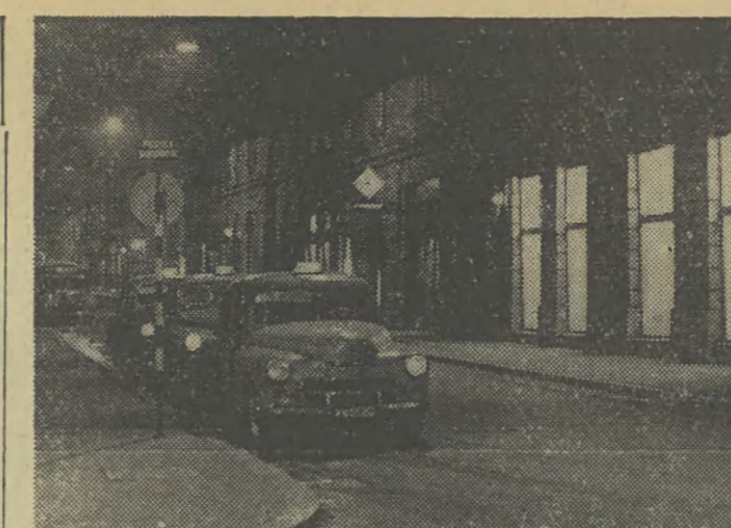
Kraków nocą: Zniknęły z naszych ulic „dryndy” i dorozki. Ich miejsce zajęły taksówki. Na zdjęciu — ostatni taksówkarz w porze nocnej przy ul. Sławkowskiej.

ARSEN LUPIN (wl.-fr., 16 lat) — 18, 20, 15. WRZOS: Pechowice na preli (USA, 12 lat) — 15, 18, 20, 15. ZUCH I ZDROWIE: nieczynne. ZWIĄZKOWIEC: Szatan (wl., 16 lat) — 17, 19.