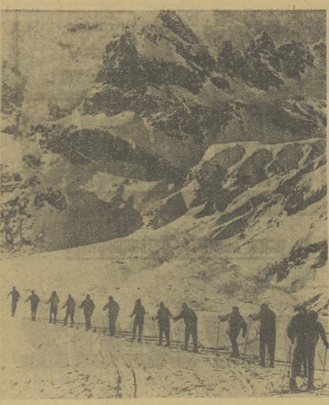
OBOZ ALPINISTÓW W KABARDYNO-BALKARI