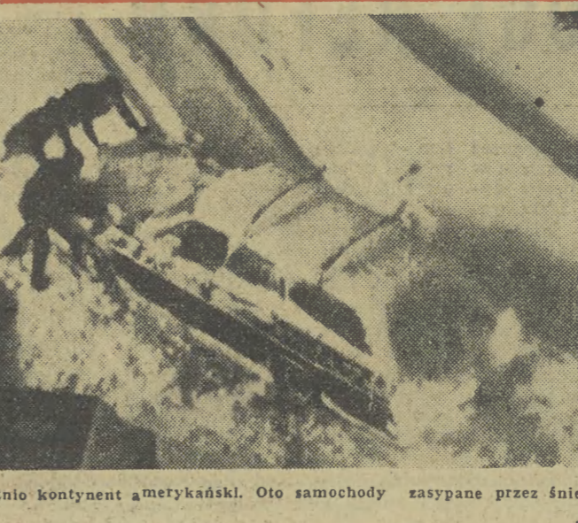
Burze śnieżne nawiedziły też ostatnio kontynent amerykański. Oto samochody zasypane przez śnieg w Portland (USA).

W Hesji (NRF) wykryto szajkę fałszerzy pieniędzy, która grasowała w NRF od kilku miesięcy. Policja zachodnioniemiecka wpadła na trop prowadzący do „wytwórni” fałszywych marek zachodnioniemieckich. Jej „moc produkcyjna” wyniosła 2,5 mln marek zachodnioniemieckich. Kilka dni temu skonfiskowano w Strasbourgu (Francja) kilkadziesiąt banknotów 100-markowych, wyprodukowanych prawdopodobnie w wyżej wspomnianej „miejscu”.