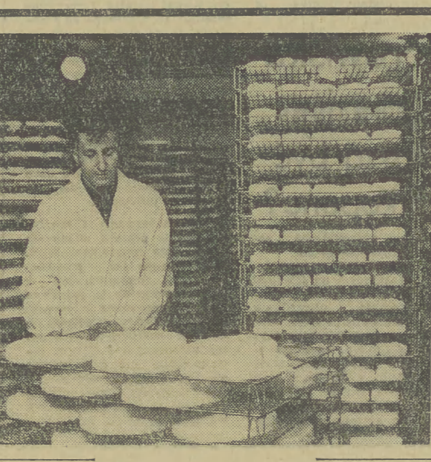
Nie jesteśmy jeszcze potentatem ilości wytwarzanych gatunków sera, ale produkcja ich stale wzrasta i równocześnie z nią konsumpcja. Na zdjęciu: w dojrzałym serów Spółdzielni Mleczarskiej w Gnieźnie.

W codziennym życiu zachodzą przypadki, w których należy zdecydować bezpośrednio i szybko. Często trzeba przeprowadzić rozmowę z określonym towarzyszem. Dają one z zasady pozytywne wyniki, a przeprowadza je sekretarz lub członek Egzekutywy. Są szersze, bardziej swobodne od prowadzonych na zebraniach partyjnych.