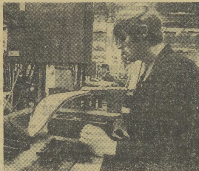
Wytwórnia Nart „Szaflary” dla krótkich sportowców produkują ok. 60 tys. par nart w 14 rodzajach. Obok zjazdowych wyrabia się tu również narty biegowe i skokowe.

to właśnie stanowisko Instytutu, jego natychmiastowa gotowość i sprawność, z jaką rozpoczął bezwzględnie akcję kształcenia młodej kadry naukowej, będąc dopiero w fazie organizacyjnego konstytuowania się — zasługują na szczególne podkreślenie. Dzięki temu szkół na już w tej chwili grupę 50 osób — spośród nich 39 to uczestnicy 3-letnich studiów doktoranckich, prowadzonych systemem stacjonarnym i (na mniejszą skalę) zaocznie. W ramach tych studiów Instytut szkoli również sporą grupę młodej kadry asystenckiej z myślą o swoich własnych potrzebach rozwojowych. Zjawiskiem wysoce pozytywnym jest duże zainteresowanie tym kierunkiem studiów. W 1969 r. zgłosiło się nań 50 kandydatów, w roku bieżącym było natomiast 80 ubiegających się — w obu przypadkach przyjęto 12 osób na studia dzienne i 8 na zaoczne. Wśród tych, którzy kontynuują je już drugi rok, większość podjęła tematy prac doktorskich — fakt również godny uwagi, jako że od sprawnego i terminowego przebiegu owych studiów zależy realne widoki poprawy sytuacji kadrowej w wielu uczelniach naukowych ośrodkach naukowych nie tylko zresztą z terenu Krakowa. Na rychłe wyniki pracy Instytutu w tej dziedzinie liczą również szko-