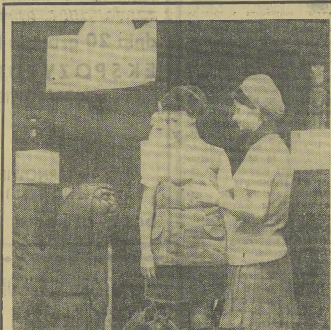
W warszawskim Muzeum Historycznym otwarta została wystawa „Tytus Chałubiński — życie i dzieło”. Zorganizowana ona została w 150-lecie urodzin tego działacza i społecznika. Na wystawie eksponowane są także wyroby podhalańskiej sztuki ludowej.

Jeszcze do 1968 r. trudno było mówić w groma-