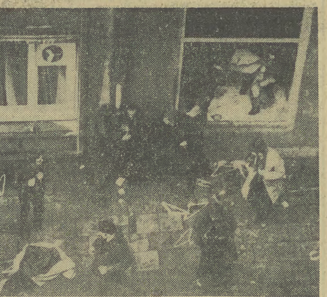
Zajścia w Gdańsku wywołane przez elementy awanturnicze przejawiały się również w grabieżach sklepów.