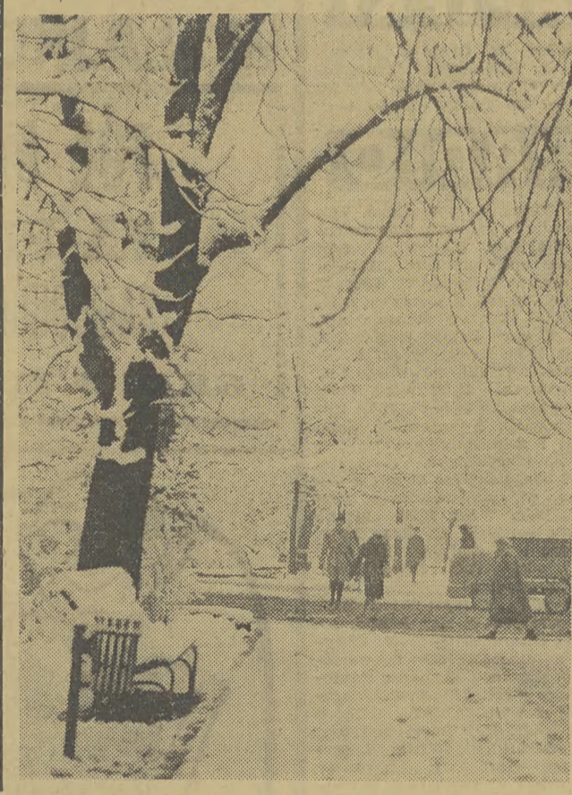
Piękno zimy

Na wszelki wypadek warto pamiętać, że od remontu do remontu musi upłynąć co najmniej 2 lata, a w niektórych branżach dłużej. W oparciu o to wiedzę trzeba będzie — kontrolować.