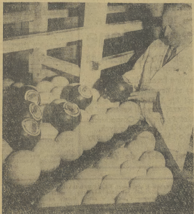
CAF — fot. Gill