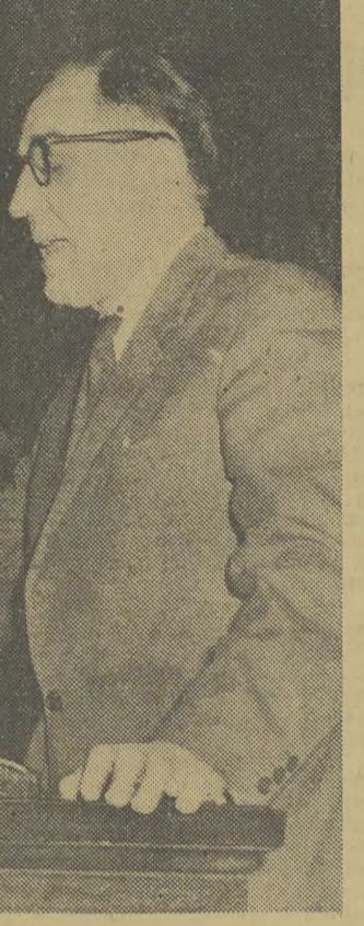
Na zdjęciu: Na trybunie sejmowej — poseł Franciszek Bilnowski — generalny sprawozdawca projektu uchwały o Narodowym Planie Gospodarczym na rok 1962.

Blisko dwanaście godzin z małymi przerwami obradował wczoraj nasz parlament kontynuując dyskusję nad projektem planu gospodarczego i budżetu. Wczoraj zabrało głos 20 mówców. W tym dwóch przedstawicieli rządu, minister przemysłu ciężkiego Franciszek Waniolka i wiceminister budownictwa Stefan Farjaszewski.