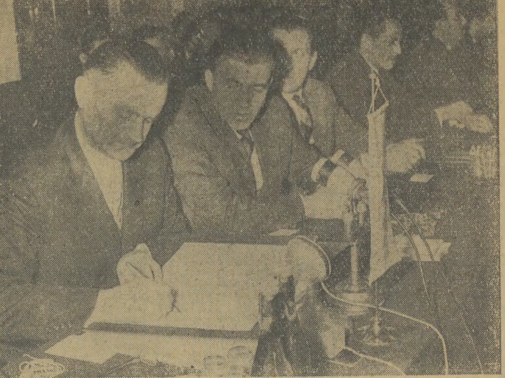
15 bm. na zakończenie obrad XV Sesji Rady Wzajemnej Pomocy Gospodarczej nastąpiło podpisanie końcowego komunikatu. Na zdjęciu: tekst komunikatu podpisuje delegacja polska.

(Inf. wł.) Na zaproszenie Biura Wzajemnej Pomocy Gospodarczej w Polsce 5-osobowa delegacja Komitetu Centralnego Związku Młodzieży Węgierskiej przybyła do Krakowa. Głównym kierownikiem delegacji węgierskiej zwiędził Nową Hutę i odbył rozmowę z sekretarzem do spraw ekonomicznych KW PZPR na temat obecnej sytuacji gospodarczej Polski. Delegacja węgierskiej młodzieży spotkała się z krakowskimi studentami w „Klubie pod Jaszczurami”. Delegacja Związku Młodzieży Węgierskiej zwiędziła również Oświęcim i spotkała się ze studentami Politechniki Krakowskiej. Gościom towarzyszył dyrektor Biura Wzajemnej Pomocy Gospodarczej w Polsce J. Felc.