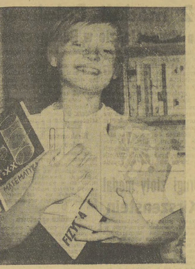
Państwowe Zakłady Wydawnictw Szkolnych przygotowały w tym roku dla młodzieży szkół ogólnokształcących 18,5 mln podręczników szkolnych. Pełny komplet książek otrzymał uczniowie sódznych klas szkół podstawowych.