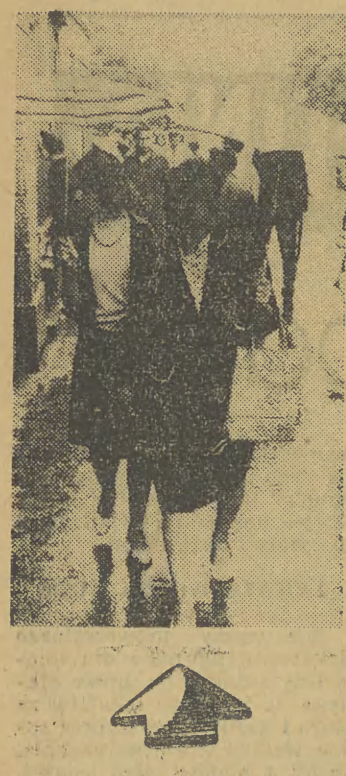
Parasole znów w modzie. Widać, że nie chce być „gorzki” od swego deszczowego poprzednika — lipca i na koniec dąży nas mokrymi wrażeniami.