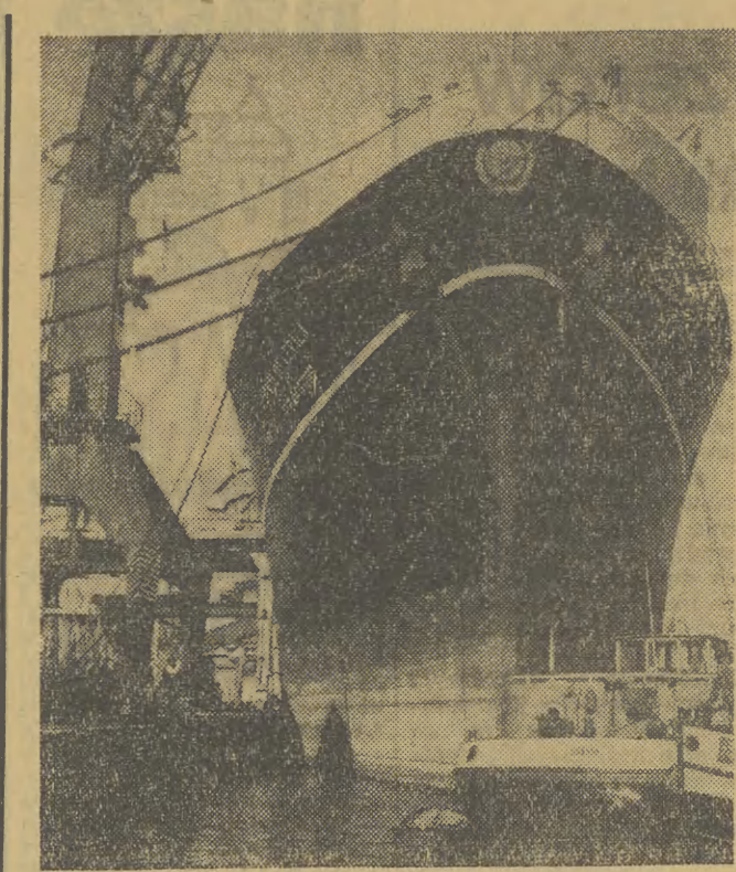
W porcie gdyńskim rozpoczął załadunek towarów do portów Indyjskich frachtowiec „State of Kerala”. Frachtowiec zabiera również potężny silnik wyprodukowany przez zakłady „H. Cegielski” w Poznaniu. Na zdjęciu: statek indyjski w porcie.

Wszelkie niewygody, trudności w przystosowanie obiektu do potrzeb młodych użytkowników w pełni wynagradza — piękny krajobraz, znakomite powietrze i uroczą bieszczadzką okolicę. I chyba nikt z kilkusetosobowego grona chłopców i dziewcząt, którzy od pierwszych dni lipca przewieźli się przez obóz, nie żałuje wyjazdu w Bieszczady,