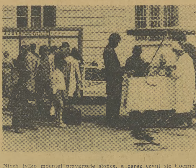
Niech tylko mocniej przygrzeje słońce, a zaraz czyni się toczno przed ulicznymi wozkami z wodą sodową...

I jeszcze jedna zmiana. Jutro MPK rozpoczyna remont torowiska na ul. Zwierzynieckiej, wobec czego tramwaje kursować będą na pewnym odcinku po jednym torze. Aby uniknąć ewentualnej blokady wozów przed wiadukdem na tor pojedynczy, zdecydowano, iż linia nr 21 przez okres remontu kursować będzie z Dworca Towarowego na Małe Błonia zamiast na Salwator. (jap)