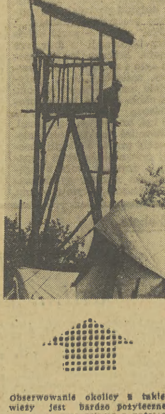
Obserwowanie okolicy w takiej wieży jest bardzo pozytywne, można w czasie ostrzeć o pożarze.