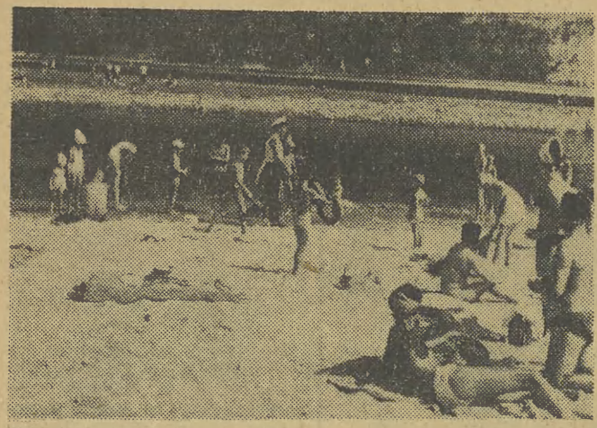
Foto-miśkawa z minionej niedzieli. Na zapelnionej nadwiślańskiej plaży interweniują funkcjonariusz milicyjny służby wodnej. Mimo zakazu, wielu amatorów kąpiel wciągało do wody. W brudnych, zakazanych nurtach rzeki.

to szerokie propagowanie osiągnięć współczesnej techniki tak wśród naukowców jak i pracowników przemysłu. Ze wszech miar zasługują więc na poparcie ze strony władz naszego miasta — sugestie zmierzające do organizowania w Krakowie stałych targów aparatury naukowej i sprzętu pomiarowego. Obok dotychczasowych „przemysłowych partnerów” uczelni z propozycjami organizowania podobnych ekspozycji występują już firmy z Francji, Anglii i NRF. Czas więc — i chyba sprzyjająca okazyja — aby w oparciu o doświadczenia AGH nadać organizowaniu wystawom charakter szerszy, wykraczający poza mury uczelni i uczynić Kraków miejscem spotkań specjalistów i fachowców z wielu krajów. (Jap)