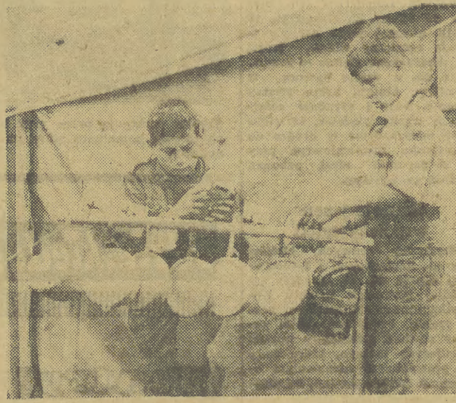
Lalk nie wiele sromnie, po co takie urządzenia powstają na obozach, ale trzeba było w nie włożyć wiele pomysłowości.