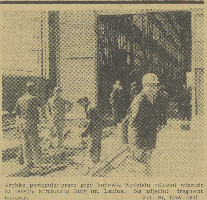
Szybko postępują prace przy budowie wydziału odlewni wiewnie na terenie Kombinat Huty im. Lenina. Na zdjęciu: fragment budowy.

I druga sprawa z ul. Wrocławskiej. W części parterowej bloku numer 62 znajdują się pomieszczenia sklepowe. W związku z odniedaniem do użytku nowych mieszkalnych bloków przez spółdzielnię „Krakus” — uruchomiono tam sklep spożywczy i mięsny oraz zakład fryzjerski. Ale jedno pomieszczenie, stoją nadal niewykorzystane, a w nim można by otworzyć sklep warzywniczy, względnie meczarski, jako że brak takich w okolicy. Czykamy na pozytywne zatwierdzenie tej sprawy. (ans)