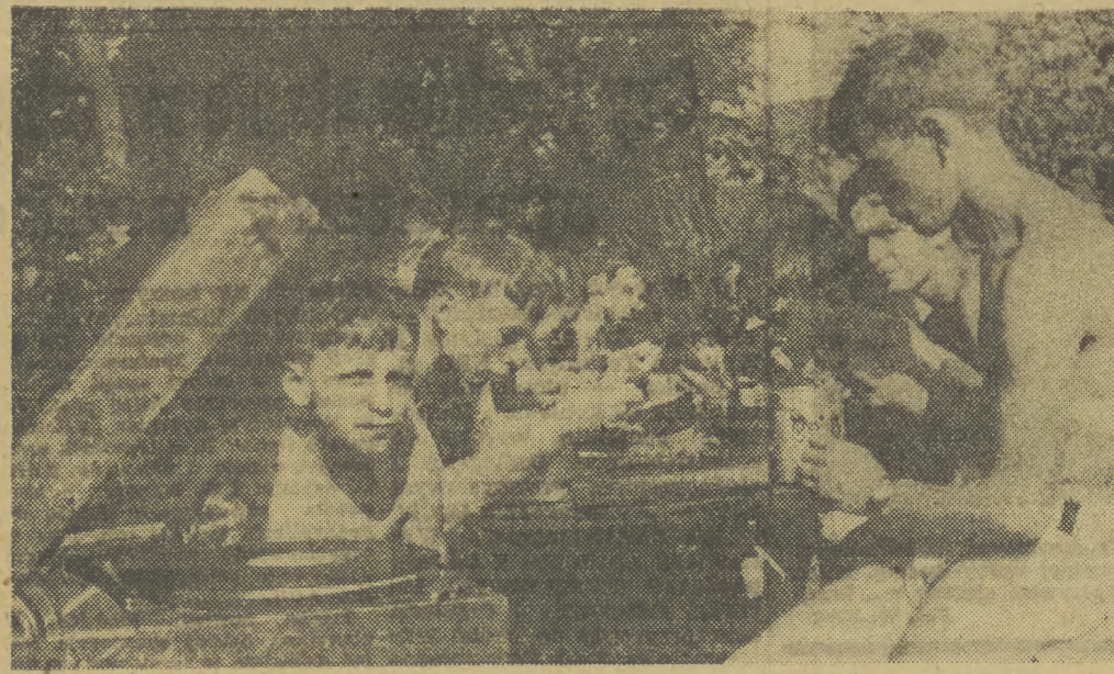
Patefon umiła smaczne posiłki... Szkoda tylko, że tak mały wóbot płyt

W uroczej kotlinie rzeki Ropy, w Uściu Gorlickim rozbiły swe namioty harcerki i harcerze z Hufca Kraków-Łobzów. Od dwu miesięcy rozbrzmiewają tam piosenki harcerskie i wesoly gwar. Ludność miejscowa polubiła krakowskich harcerzy. Jest im wdzięczna nie tylko za atmosferę, jaką wytworzyli, ale i za pomoc przy żniwach, za opiekę nad dziećmi w zorganizowanym przez I K. D. H. zielonym przedszkolu.