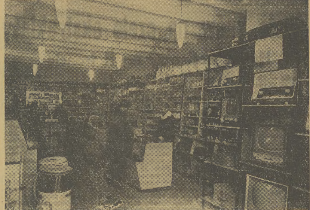
Tak to powinno w wielu gromadach wyglądać. Na zdjęciu sklep artykułów gospodarstwa domowego w GS w Lipowej pow. Żywiec.

Tak ogólnie szacuje się tegoroczne zbiory zbóż w świecie, mimo, że tak np. jak w Polsce, w wielu krajach były kłopoty ze złowalnym (położone zboża). W Bułgarii uzyskano rekordowe zbiory pszenicy — 24 q z ha, w Rumunii ogólne zbiory będą o 20 proc. wyższe, w Europie zachodniej o ub. r. i mln ton więcej niż w ub. roku, podobnie w Stanach Zjednoczonych (ogółem, zbiorów ok. 36 mln ton). Jedna Francja będzie w br. miała ok. 4 mln t. pszenicy na sprzedaż.