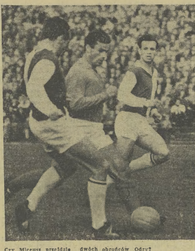
Czy Miceusz przejdzie dwóch obrońców Odry?

Spotkanie decydujące o zakwalifikowaniu się do półfinału mistrzostw Polski juniorów Wisła przegrała z Mazurem. Karzów w drugiej kolejce rzutów karnych, Mecz bowiem zakończył się na boisku wynikiem remisowym 1:1 (1:0).