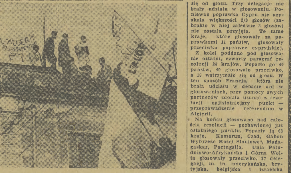
„Niech żyje FLN”, „Niech żyje Ferhat ABBAS!” — pod tymi hasłami wyszli na ulice miast algerijskich ich prawowici gos- podarze. Jest to odpowiedź na gwałty i prowokacje ultra- sów, na masakrę dokonaną przez armie. Algierczycy chcą pełnej niepodległości. Na zdjęciu: młodzi patrioti algerijs- cy z hasłami i sztandarami na dachach arabskich domów. O aktualnej sytuacji w Algierii czytają nasz komentarz za- mieszczony obok.