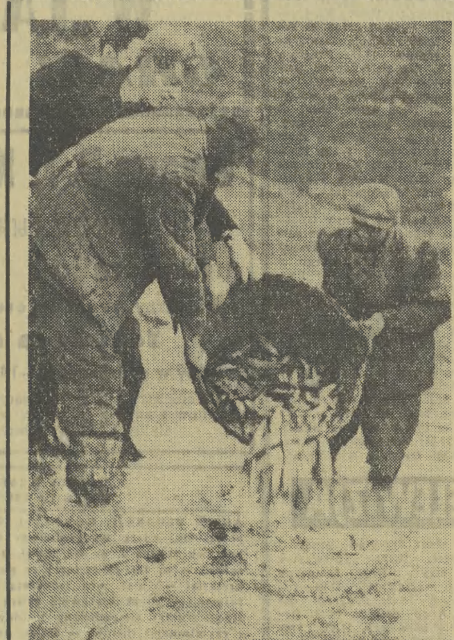
Polski Związek Rybacki (oddział w Rzeszowie) przystąpił do zarybiania wód nowego jeziora powstałego na Sanie w Myszkowcach. W roku bieżącym zostanie wypuszczonych do jeziora 7000 sztuk szupczaka, 4500 sztuk karasia, 9000 sztuk lina i 12.000 sztuk leszcza z naszych wód oraz sandacze i węgorze importowane z Francji. Na zdjęciu: Zarybianie jeziora w Myszkowcach.

A bez nich — żeby plany były nawet srebrne i złote, i brylantowe — ani (MŻ 78) zsn