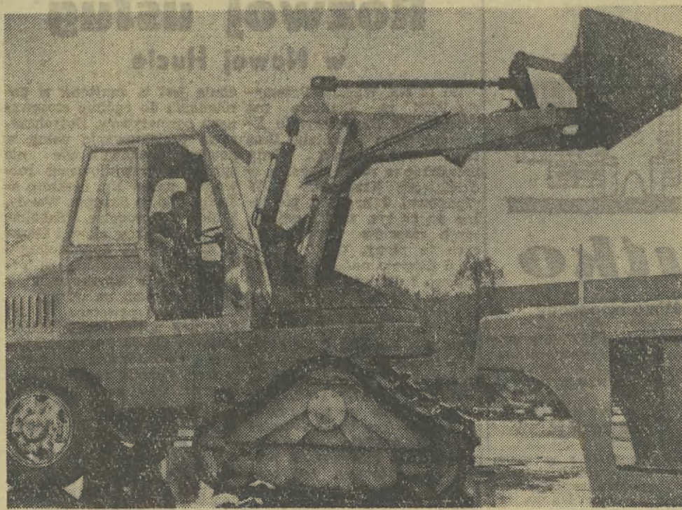
Wrocławska Fabryka Maszyn Budowlanych „Fadroma”, przystąpiła do produkcji serii informacyjnej nowych ładowarek drogowych. Nowa ładowarka hydrauliczna LH-55 jest maszyną uniwersalną; może ładować i rozładowywać, może być wykorzystywana do robienia wykopów, wyfowywania terenu, może być również traktowana jako dźwieg. Ładowarka jest wyposażona w 10 kompletów urządzeń pomocniczych, używanych w zależności od tego, jakie czynności LH-55 ma spełniać. Ładowarka jest maszyną samobieżną, wyposażoną w silnik oraz cztery ogumione koła, przy czym dwa tylne mogą być wmontowane na urządzenia gąsienicowe, umożliwiające poruszanie się ładowarki, w ciężkim terenie — podmokłym, górskim itp.