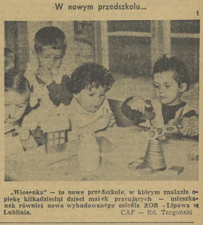
„Wiosenka” — to nowe przedszkole, w którym znalazło opiekę kilkadziesiąt dzieci matek pracujących — mieszkanki również nowo wybudowanego osiedla ZOR — Lipowa w Lublinie.

Od miesiąca działa w Krakowie Komisja Upowszechnienia Sportów Zimowych. Niestety kapryśna zima sprawiła wiele kłopotów nie tylko młodym sportowcom ale i komisji. Ognisko TKKF przy Prezydium WRN w Krakowie zorganizowało półkolonię, na którą przystąpiło do zamrażarki prowadzony miał być kurs nauki jazdy na łyżwach. Dzieci chwilowo spędzają wolny czas w gmachu WKFF, a ściślej w Klubie Działacza Sportowego, przeprowadzając suchą zaprawę i oglądając ciekawe filmy. Po zakończeniu ferii, gdy wreszcie chwyci mroź, odbędzie się już na lodzie kurs nauki jazdy na łyżwach. W przyszłości dzieci będą członkami szkółki łyżwiarskiej. Komisja upowszechniania sportów zimowych otrzymała 70 tys. zł, z czego na zakup saneczek przeznaczono 14.000, na narty — 16.000 zł, na zakup łyżew — 15.500 zł, na budowę lodowisk — 14.500 zł i na urządzenie świetlic — 10.000 zł. W Nowosądeckim powstało 6 sekcji saneczkarskich. Tam też buduje się „otwarte tory”. 37 osób przystąpiło do akcji budowy torów. W dniach 2—3 stycznia 1960 miała się odbyć w Krakowie kursokonferencja dla organizatorów masowej nauki łyżwiarstwa. Brak jednak lodu i nikłe zgłoszenia (przyjazd na koszt własny) spowodowały, że kurs został odwołany. Odbędzie się on w późniejszym terminie. Przyklasnąć należy akcji masowego uprawiania sportów zimowych, a w szczególności nauki łyżwiarstwa. Sport to bardzo tani i zdrowy, młodzieży każdej szkoły może go uprawiać.