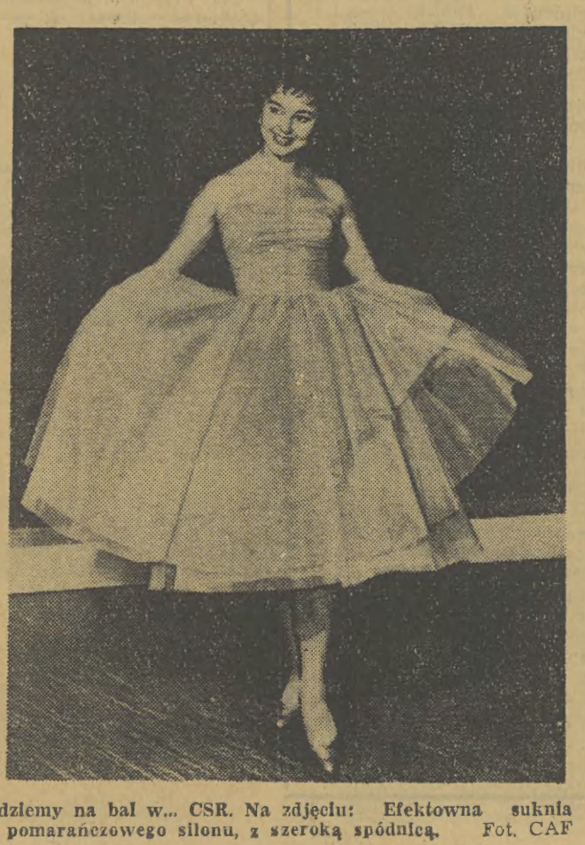
Idziemy na bal w... CSR. Na zdjęciu: Efektowna suknia z pomarańczowego silonu, z szeroką spódnicą.

29 bm. meldunek o wykonaniu tegorocznych zadań produkcji globalnej złożyła Huta im. Lenina, która do końca br. dostarczyła dodatkowo różnych wyrobów wartości ponad 20 mln zł. Najlepsze wyniki uzyskały: koksownia, aglomerownia (spiekalnia rud), wytwornia materiałów ogniotrwałych oraz wydzielni walcowniczej kombinatu, których dodatkowa produkcja w br. wyniosła ok. 27 tys. ton blach cienkich i grubych.