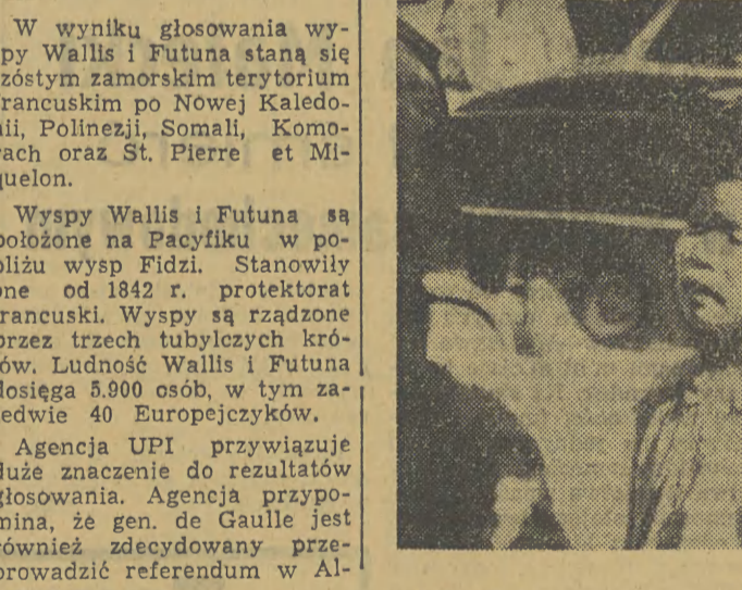
W wyniku głosowania wyspy Wallis i Futuna staną się szóstym zamorskim terytorium francuskim

PARYŻ (PAP) Według doniesień agencji prasowych, mieszkańcy wysp Wallis i Futuna wypowiedzieli się w referendum 4307 głosami przeciw 257 za przyłączeniem tych terytoriów do Francji. Pytanie postawione w referendum brzmiało następująco: „Czy pragniesz, aby wyspy Wallis i Futuna stały się integralną częścią Republiki Francuskiej jako terytoria zamorskie?” W wyniku głosowania wyspy Wallis i Futuna staną się szóstym zamorskim terytorium francuskim po Nowej Kaledonii, Polinezji, Somali, Komorach oraz St. Pierre et Miquelon. Wyspy Wallis i Futuna są położone na Pacyfiku w pobliżu wysp Fidzi. Stanowiły one od 1842 r. protektorat francuski. Wyspy są rządzone przez trzech tubylczych królów. Ludność Wallis i Futuna dosięga 5.900 osób, w tym zaledwie 40 Europejczyków. Agencja UPI przywołuje duże znaczenie do rezultatów głosowania. Agencja przypomina, że gen. de Gaulle jest również zdecydowany przeprowadzić referendum w Al-