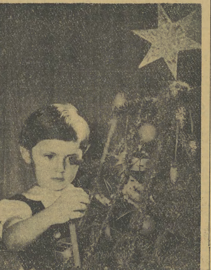
Starsze dzieci uczestniczą podczas imprezy choinkowej w grach i zabawach, oglądają seans filmowy, a na zakończenie, wraz z młodszymi kolegami, otrzymują upominki.

Krakowski Dom Kultury rozbrzmiewa od uczoraj głośnie dziećmi przybitych na doroczną imprezę choinkową. Zarówno hall jak i schody przystrojone na przyjęcie młodocianych gości. Jest i choinka ozdobiona gwiazdkami śniegu, barwnymi lampkami i inne dekoracje.