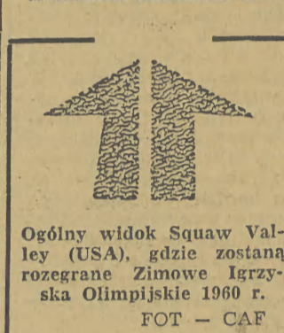
Ogólny widok Squaw Valley (USA), gdzie została rozegrana Zimowa Olimpiada 1960 r.