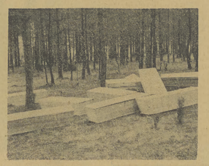
...30 prostych, białych trumien, wyłożonych białym płótnem...