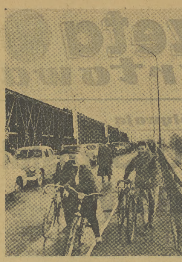
DWA NOWE MOSTY W SZCZECINIE. Szczecin otrzymał dwa nowe mosty na Odrze i jej odnocy Regalic, które połączyły prawo- i lewobrzeżne dzielnice miasta. Mosty wybudowały dla mieszkańców Szczecina żołnierze i oficerowie jednostek saperkich WP.

Ewidencja i kary. Wymiana legitymacji partyjnych w organizacjach PZPR woj. krakowskiego została w zasadzie zakończona. Wydział Organizacyjny KW przygotowuje obecnie ocenę całości kampanii. Do grudnia br. wydano ogółem ponad 60 tys. nowych legitymacji partyjnych. Do odebrania pozostało jeszcze około tysiąca legitymacji. Są to legitymacje towarzyszy przebywających za granicą, w sanatoriach i w szpitalach. Według wstępnej oceny, wymiana legitymacji była okresem ożywienia pracy partyjnej i pozwoliła wielu organizacjom wyjść z organizacyjnego impasu.