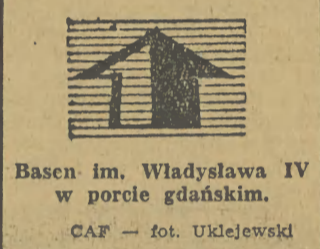
Basen im. Władysława IV w porcie gdańskim.

— Nie wiem czy konieczna, ale fakt jest, że prawie wszędzie spotyka się angielskie nazwy. W Moskwie istnieje „Mikolaj Kapustin Combo” w Leningradzie — „Seven Dixie Lands”, podobnie w innych krajach. Dlatego i u nas przyjęły się ten angielski żargon jazzowy.