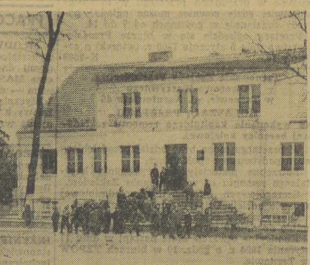
Jedna ze szkół Tysiąclecia oddanych do użytku młodzieży w tym roku jest 7-klasowa szkoła podstawowa w Gostkowie. Poza salami wykładowymi, świetlicą itp., w budynku mieszczą się także trzy mieszkania dla nauczycieli. Z nowej szkoły korzysta 176 dzieci z trzech okolicznych gromad. Na zdjęciu: Nowy budynek szkolny.

Udział kobiet w kierowaniu administracją rumuńską jest bardzo wysoki: zajmują one 20 proc. kierowniczych stanowisk. Rumuni chlubią się ponadto 4000 kobiet inżynierów i 5000 kobiet lekarzy.