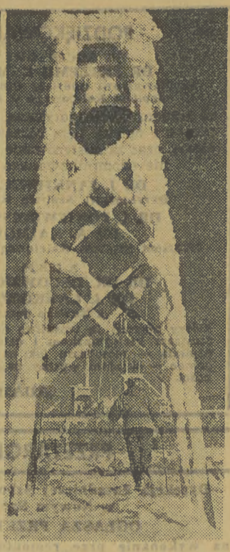
Do Zakopanego ścigają amatorzy białego szalstwa... Na zdjęciu: Na szczyście Kasprzewo.

bywa się kurs zapoznający uczestników spisu ze sposobem przeprowadzenia tej akcji. Podobne kursy zorganizowane zostaną w poszczególnych województwach. Warto dodać, że spis powszechny jest przeprowadzany w tym okresie nie tylko w Polsce. Na zalecenie Organizacji Narodów Zjednoczonych wszystkie państwa na świecie przeprowadzą w sobie w latach 1959-1960 spisy powszechne. Materiały pochodzące z tych spisów pozwolą ONZ na zorientowanie się w aktualnych zagadnieniach demograficznych, w warunkach ekonomicznych i socjalno-bytowych ludzkości. (AR)