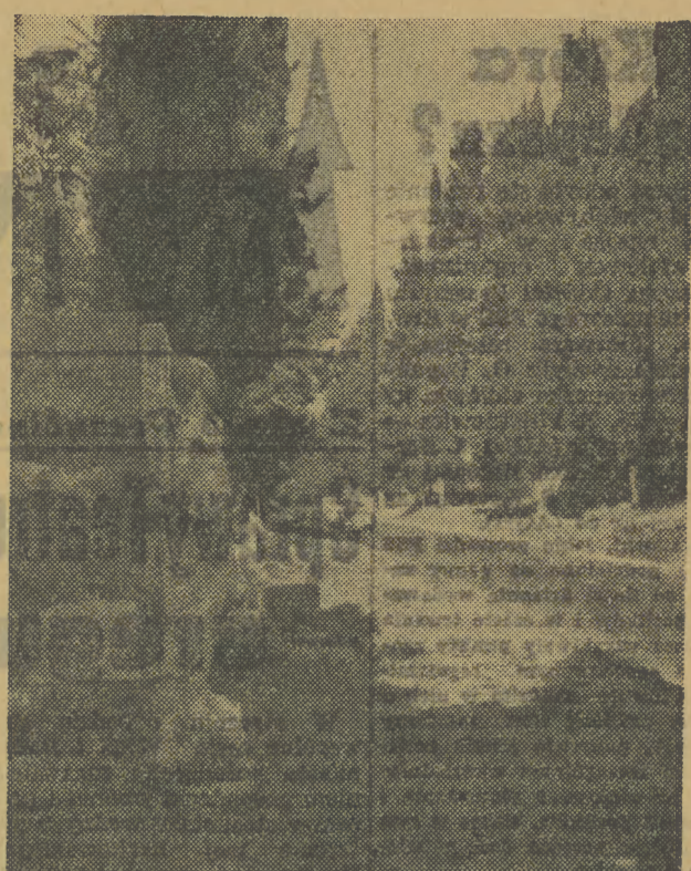
Via Appia Antica znana nam z „Quo vadis?”