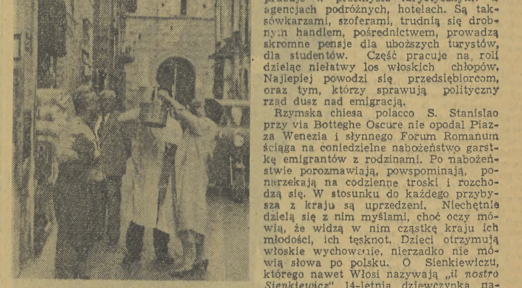
Wąskie uliczki Neapolu obfitują w takie sceny. „Prywatną windę” — koszyczek, spuszcza się na sznurku, aby wciągnąć go z powrotem obladowany zakupami.

Czy można mówić we Włoszech o Polonii? Stara i nowa emigracja wraz z księżmi i zakonnikami liczy 1.200 dusz. Polacy rozproszyli się po całym kraju. Mieszkają przede wszystkim w miastach i miasteczkach. W Rzymie, nie licząc duchownych polskich, jest 50 emigrantów. W Wenecji 11. Jednym się powiodło, innym nie. Tym, którzy zrobili tzw. dobre partie matelnie wiedzie się na ogół najlepiej. Mają przedsiębiorstwa, hotele. Ponoć jeden z weneckich Polaków dostał w posagu żony pałac, służba jego chodzi w libelii, posiada hektary, których nawet nie zdola zliczyć. Wielu Polaków pośrednio i bezpośrednio pracuje w przemyśle turystycznym: w agencjach podróży, hotelach. Są taksówkarzami, soferami, trudnią się drobny handlem pośrednictwem, prowadzą skromne pensje dla uboższych turystów, dla studentów. Część pracuje na roli, dzieląc nielatywo los włoskich chłopów. Najlepiej powodzi się przedsiębiorcom, oraz tym, którzy sprawują polityczny rząd dusz nad emigracją.