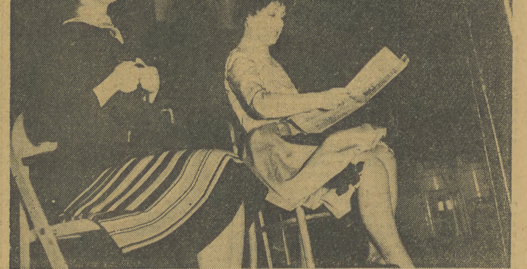
Na zdjęciu: Lidia Korsakówna i Hanka Bielicka w jednym z skeczów.

W dniu wczorajszym przekonał się kto ma największe szczęście. Konkurs „Gazety Krakowskiej”, „15 lat Ziemi Krakowskiej w Polsce Ludowej” dobiegł końca. W czasie imprezy, w której wzięli udział: Hanka Bielicka, Lidia Korsakówna, Józefina Pellegrini, Kazimierz Brusikiewicz, Jerzy Duszyński i Wiktor Osecki oraz orkiestra „Moderniści” pod kier. Andrzeja Kurylewicza — wylosowano pierwsze nagrody.