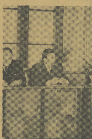
Na zdjęciu: Prezydium II Okręgowego Zjazdu Towarzystwa Rozwoju Ziemi Zachodnich w Krakowie.