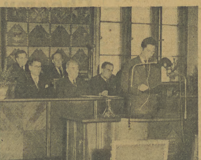
Na zdjęciu: Prezydium II Okręgowego Zjazdu Towarzystwa Rozwoju Ziemi Zachodnich w Krakowie.