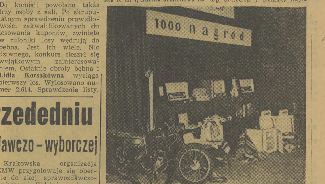
Na zdjęciu: motocykl, telewizor, pralki, aparaty radiowe itd. to tylko część z długiej listy nagród konkursu