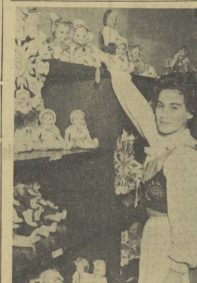
Lalki na gwiazdkę dla dzieci CAF — Fot. Wołoszczuk

2 mln ton węgla dodatkowo wydobyli już górnicy w br.