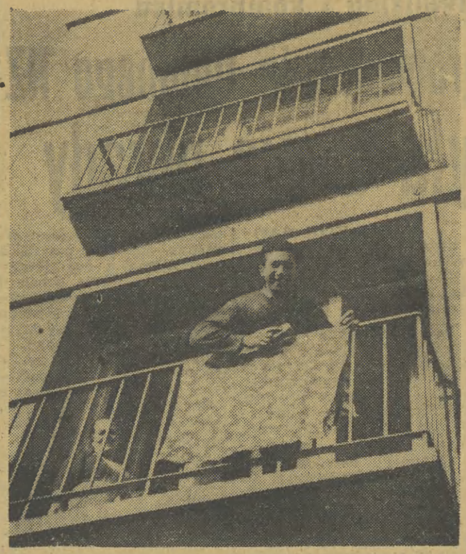
O rocznej pracy Konferencji Samorządu Robotniczego w Zakładach Przemysłu Bawelnianego im. Marchlewskiego w Łodzi, świadczy m. in. zbudowanie kilku bloków dla 180 rodzin pracowników ZPB, zorganizowanie ambulatorium oraz ośrodka wczasowego w Grotkowicach.

gotowia przewiozła go do szpitala. O wypadku powiadomiono MO.