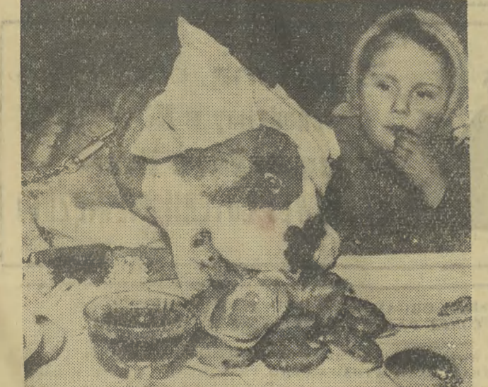
W czasie przyjęcia gwiazdkowego dla dzieci, wydanego przez Ligę Opieki nad Zwierzętami w Londynie, bokser pełniący wraz ze swą panią rolę gospodarza zapomniał o dobrym wychowaniu na widok zastawionego stołu...

Wątpliwości te wyrażają i inne dzienniki.