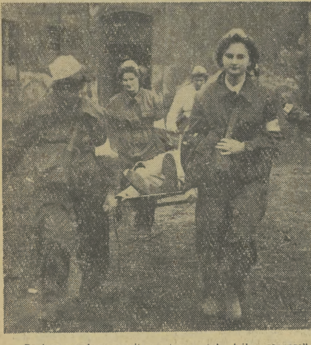
Drużyna medyczno-sanitarna transportuje ciężko „rannego”.