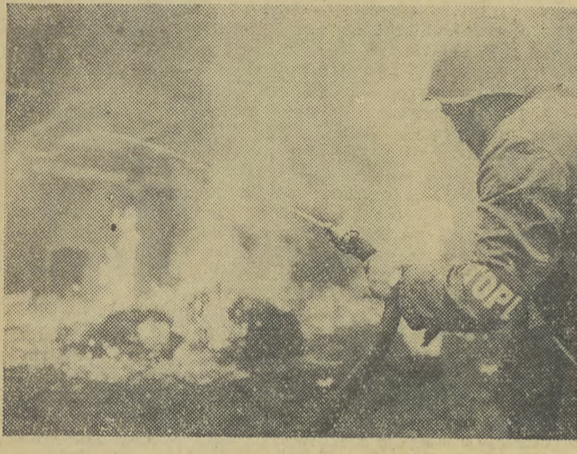
Drużyna przeciwpożarowa w akcji.