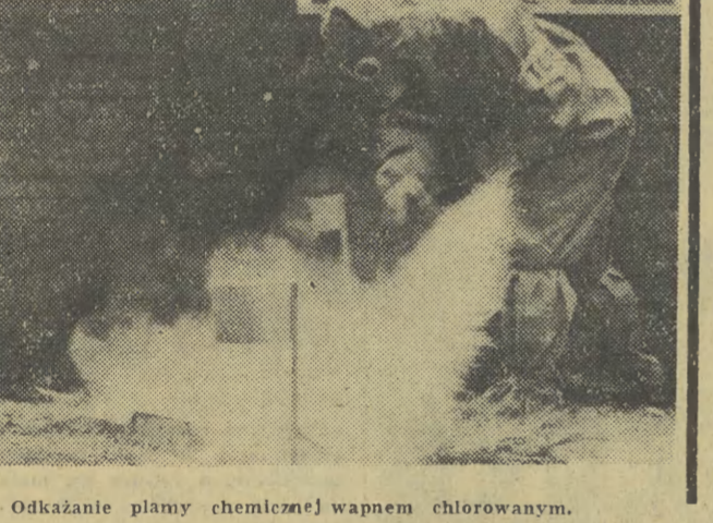
Odkazanie płamy chemicznej wapnem chlorowanym.