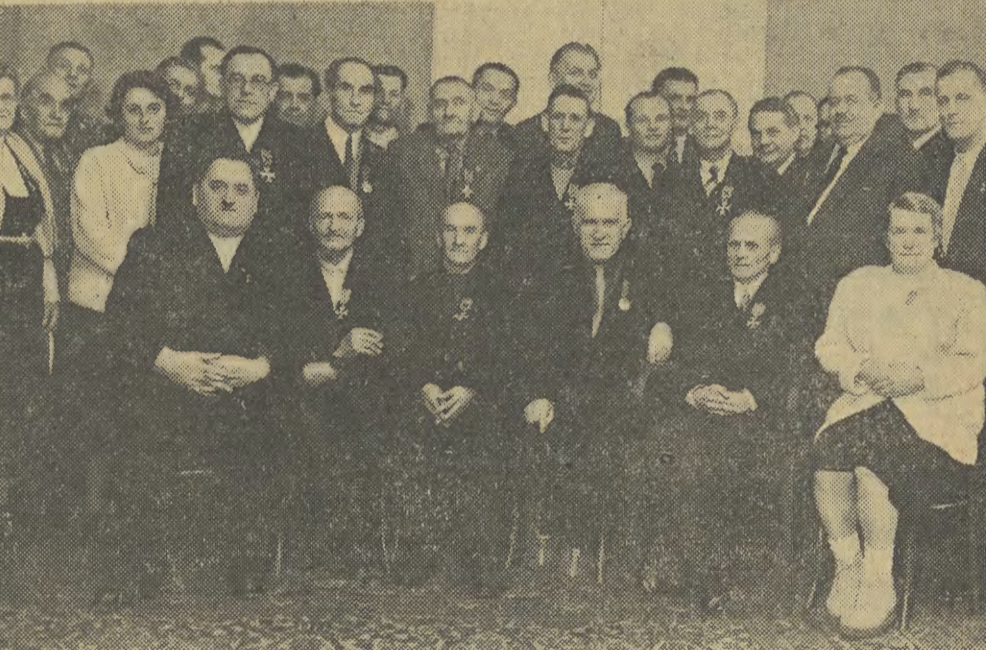
Grupa byłych działaczy KPP, którzy w ubiegłą sobotę udekorowani zostali wysokimi odznaczeniami państwowymi.