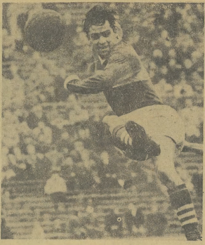
Rasowy piłkarz, jak zeń? rzadko oglądany niestety na naszych boiskach. „Uchwycił” go fotoreporter CAF-u Szymkowski. Zdjęcie wystawione zostało na krajowym konkursie fotografii w Warszawie.