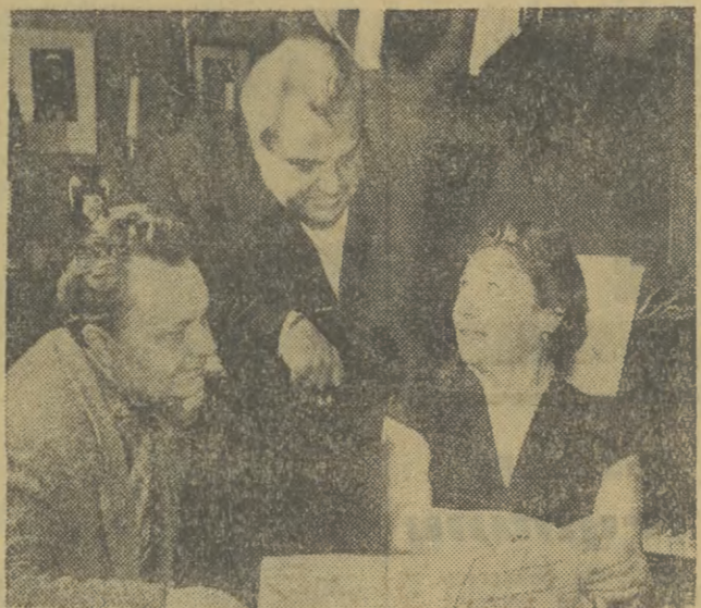
Uczony radziecki, Akademik Iwan Artobolewski jest wybitnym uczniem w dziedzinie teorii maszyn. Na zdjęciu: Iwan Artobolewski (pośrodku) z małżonką Olgą — kompozytorem oraz z artystą Iwanem Pleitrowem — wykonawcą nowego utworu Ołgi Artobolewskiej.