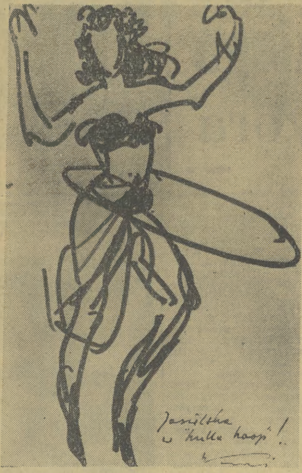
Jasiełka w hulla hoop!