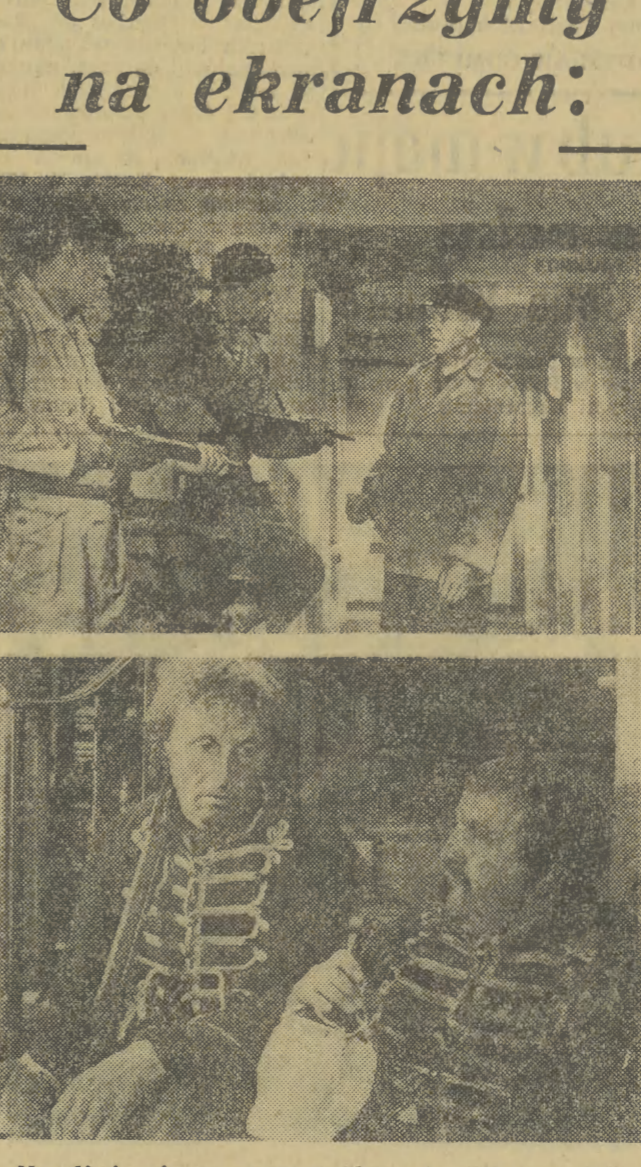
Na zdjęciu górnym: scena z filmu pt. „Bitwa o ciężką wodę”. Na zdjęciu dolnym: scena z filmu pt. „Huragan”.