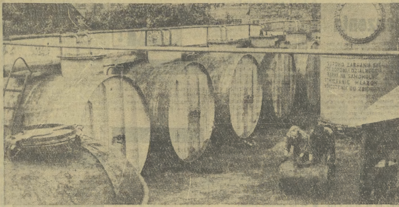
Fabryka Farb i Lakierów we Włocławku jest zakładem, który produkuje na życzenie klientów. Tu nie musi się brać tego, co jest. Kupujący zamawia towar, zakład wykonuje i... wszyscy są zadowoleni. Około 5 proc. produkcji przeznaczone jest na eksport. W najbliższym czasie oddany będzie do użytku nowy dział regeneracji opakowań. Na zdjęciu: Fragment zbiorników z olejami roślinnymi.