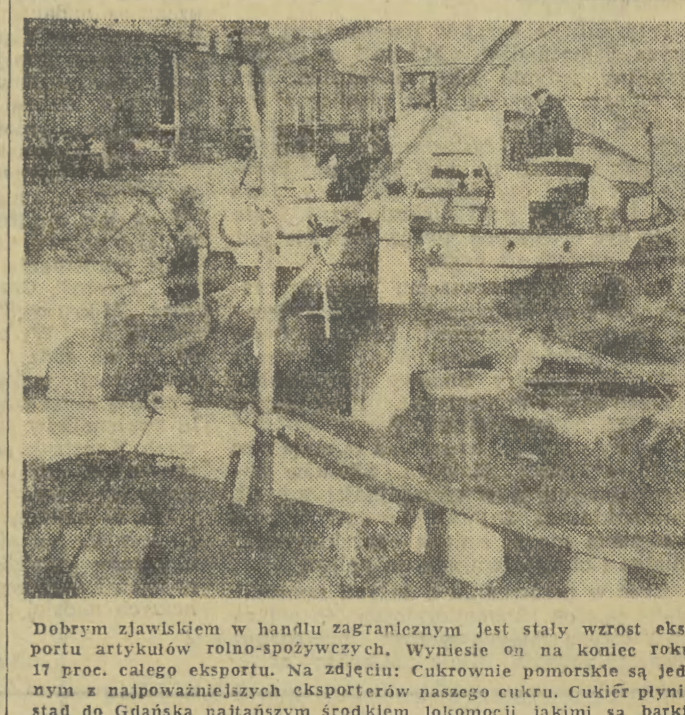
Dobrym zjawiskiem w handlu zagranicznym jest stały wzrost eksportu artykułów rolno-spożywczych. Wylistnie on na koniec roku 17 proc. całego eksportu. Na zdjęciu: Cukrownie pomorskie są jednym z najpoważniejszych eksporterów naszego cukru. Cukierni płynie stąd do Gdańska najtanszym środkiem lokomocji jakim są barki