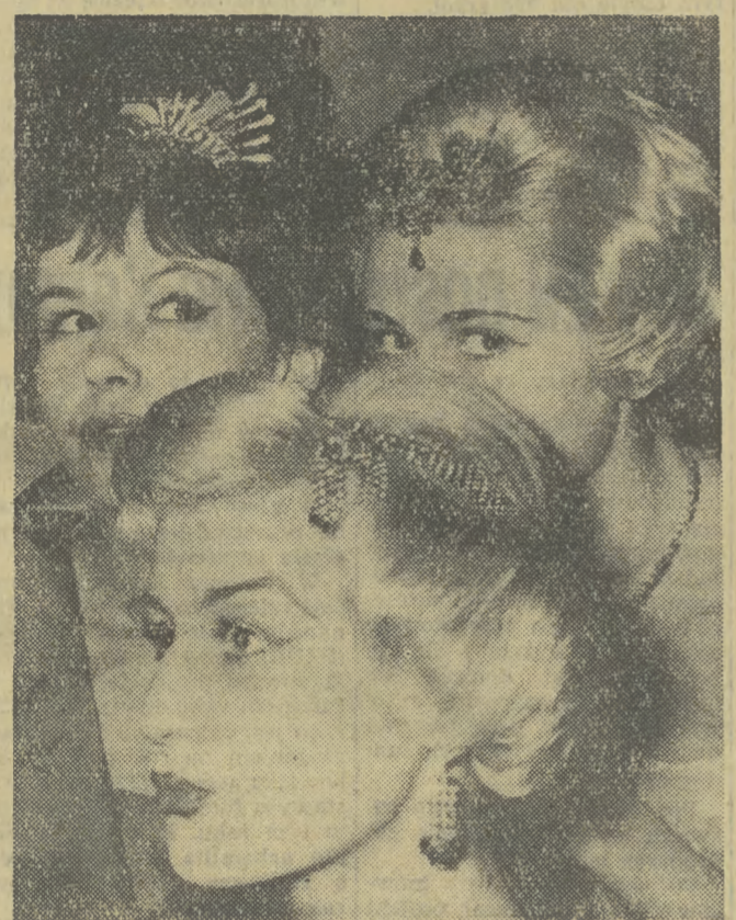
Takie fryzury lansują nadchodzący karnawał fryzjerzy wiedeńscy.