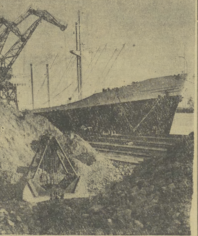
W grudniu nasze porty przyjmą około 170.000 ton rudy. Na zdjęciu: Wyladunek rudy ze statku „Dona Edie” w porcie gdyńskim.