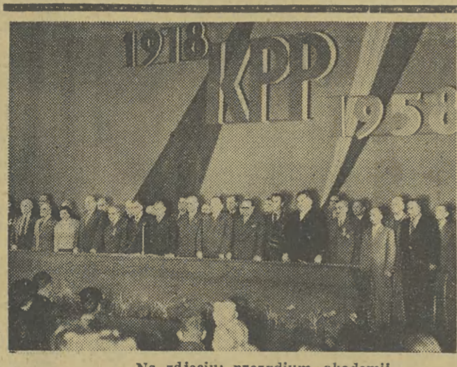
Na zdjęciu: prezydium akademii.

WARSZAWA (PAP) 14 bm o godz. 18.15 w salach Urzędu Rady Ministrów na Krakowskim Przedmieściu w Warszawie odbyła się uroczystość podpisania wspólnego komunikatu o naradach pomiędzy delegacją Komitetu Centralnego