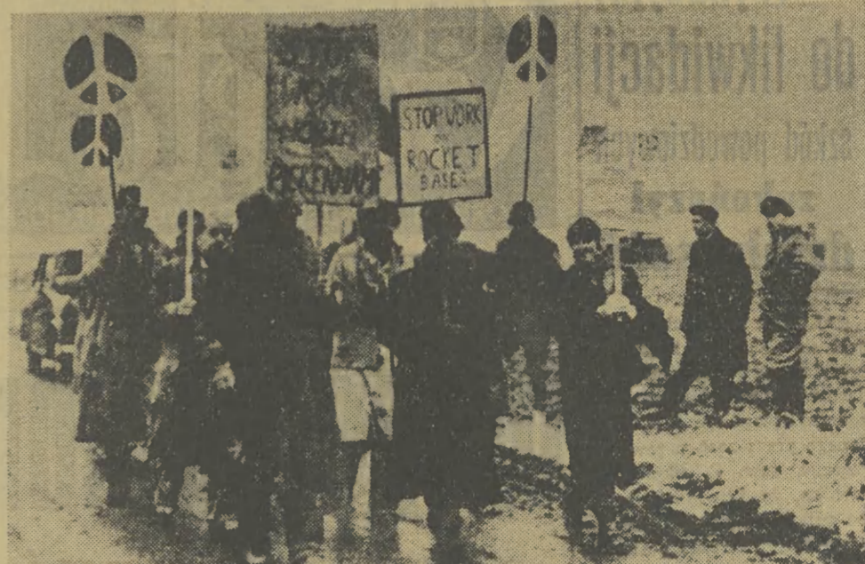
Thum demonstrantów wtargnął na teren bazy rakietowej North Pickenham w hrabstwie Norfolk domagając się zaprzestania instalacji wyrzutni rakietowych. Na zdjęciu: Uczestnicy demonstracji opuszczają bazę.