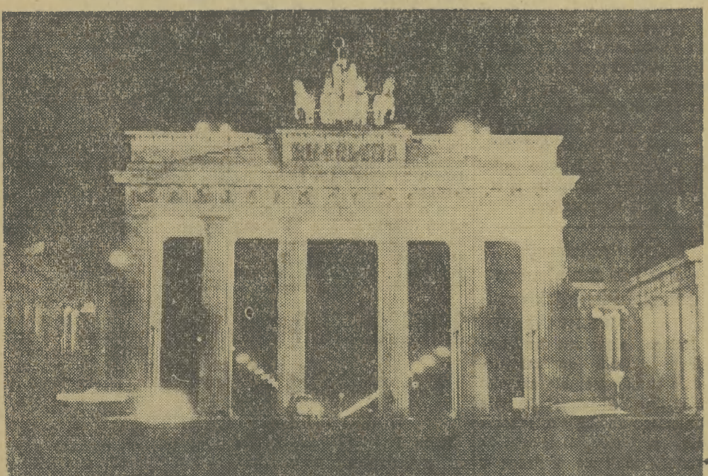
Na zdjęciu: Brama Brandenburska — iluminowana z okazji 10-lecia Demokratycznego BERLINA

Dzięki PZPR Polska znajduje się w rodzinie państw socjalistycznych i łączy ją zgodny z interesem narodowym i socjalistycznym mi dżeraniem sojusz z ZSRR.