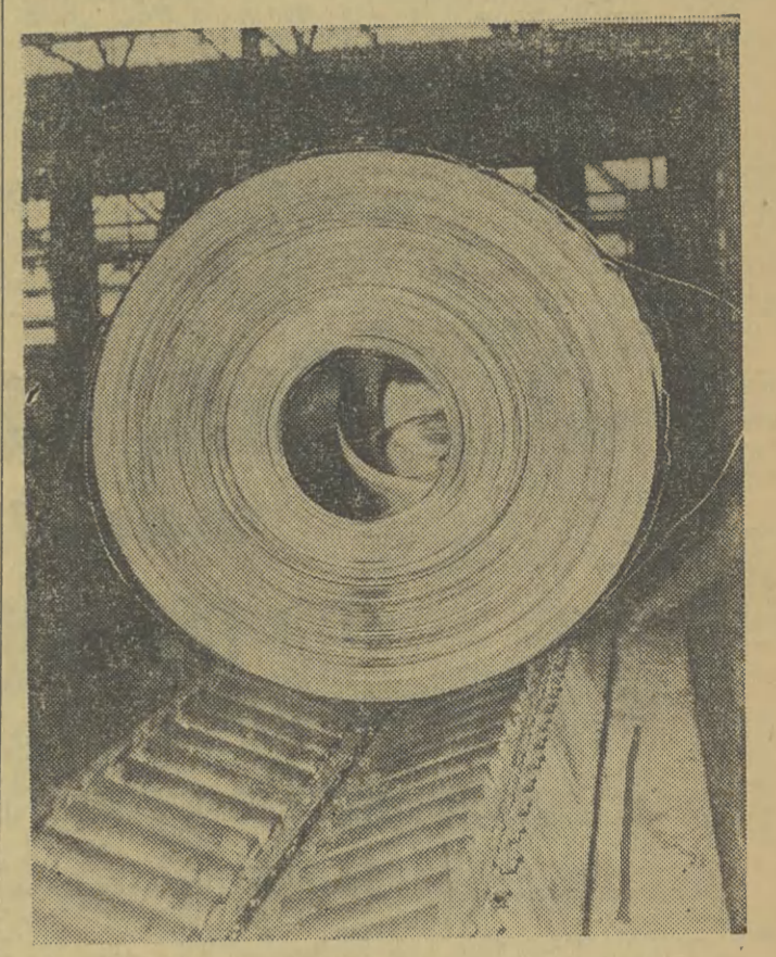
Krag blachy w...ie cyklu produkcyjnego.

cze usterki. I tak np. załoga Elektromontażu pod kierownictwem inż. Wiśniewskiego zameldowała, iż wytrawialna zostaje oddana bezusterkowo. Podobnie oddaje wyładarkę 2-klatkową załoga „Mostostalu”. (Ciąg dalszy na str. 2)