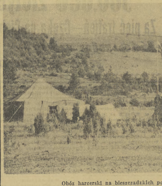
Obóz harcerski na bieszczadzkiej poloninie HAF