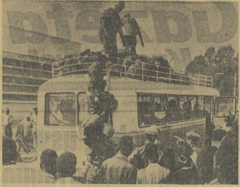
142 agentów aresztowanych