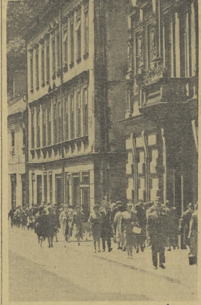
Na ulicy Wiślanej już nocno. Większość krakowian wróciła już z urlopów i wakacji.

Prognoza pogody dla Polski południowej: zachmurzenie zmienne, przeważnie jednak chmurno z większymi rozproszonymi w ciągu dnia. W godzinach rannych i nocą zamglenia. Temperatura najwyższa w ciągu dnia w granicach od 22 do 24 stopni, lokalnie przy większych rozproszeniach do 24 stopni. Nocą od około 15 do 10 stopni. W partiach szczytowych gór dniem 10-14 stopni, nocą 5-8 stopni. Wilgoty stałe i umiarkowane z kierunków południowo-zachodnich.