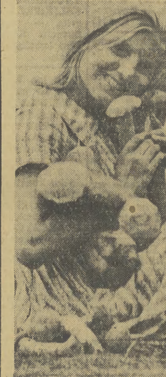
Królowa grybobrania.