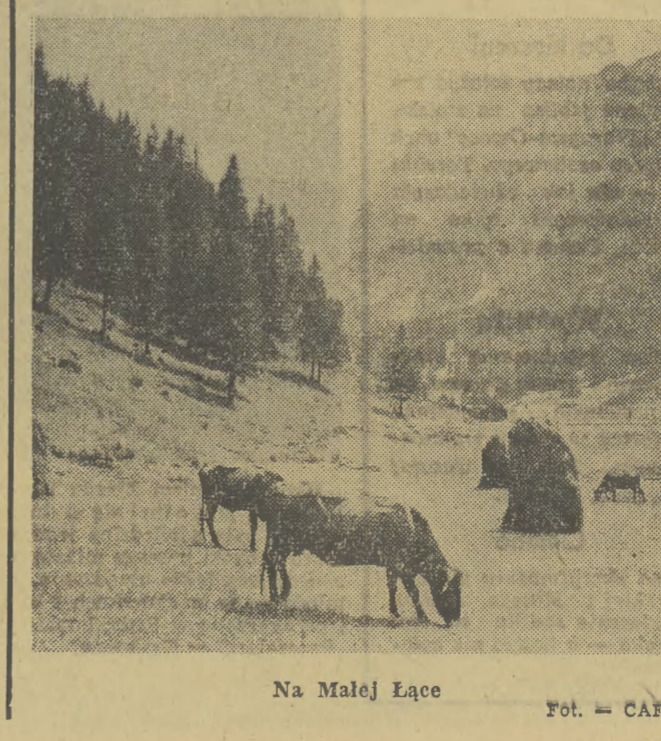
Na Malej Łące