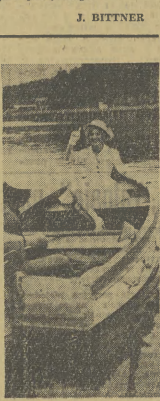
Przejażdżki po jeziorze...

Sprzedaż komisowa samochodów zostanie uruchomiona w miastach wojewódzkich i większych ośrodkach miejskich. Do komisów będą przyjmowane samochody, których stopień zużycia nie przekracza 70 proc. Ogłoszenia techniczne pojazdu będą dokonywać rzeczoznawcy Polskiego Związku Motorowego na koszt właściciela. Cenę samochodu ustalać się będzie na podstawie odliczając stopień jego zużycia.