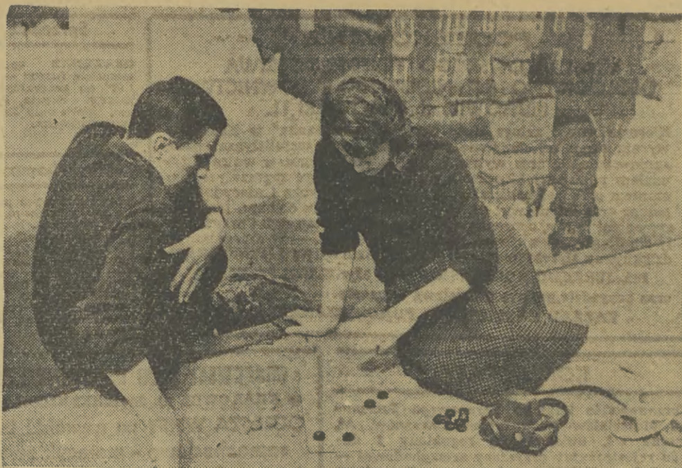
Nietypowe, ale można i tak...