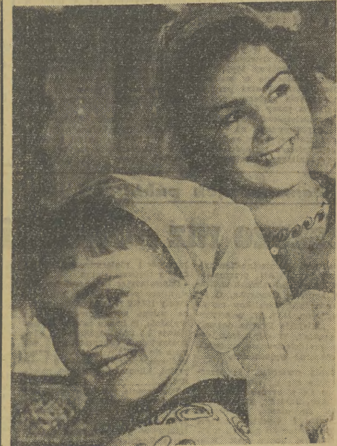
Dziwczęta z zespołu pieśni i tańca bukareszteńskie, rady narodowej, który odniósł sukcesy poza granicami swego kraju m. in. w Paryżu i Londynie.

Dobre sobie, co? I niby dlaczego budownictwo handlowe ma być takie uprzywilejowane? Moz.