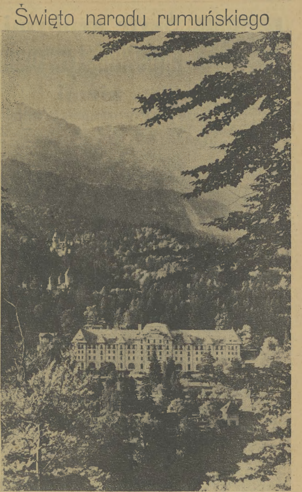
Święto narodu rumuńskiego

niach nastąpił stan nieważkości. Psy „zawisły” w kabine. Ich łapy i głowy były beznadziejnie opuszczone i na pierwszy rzut oka wyglądały jak nieżywe. Przy wykrośnięciu do stacji nieważkości, zaczęły się one interesować jedzeniem. Automatyycznie otworzyło się urządzenie z pokarmem. „Bielka” i „Strielka” przystąpiły do spożywania pierwszego kosmicznego posiłku. Następnie podczas osiemnastu okrążeń wokół ziemi, psy od czasu do czasu wykazywały pewne objawy zaniepokojenia, ale w zasadzie oswoiły się ze swoim stanem i otoczeniem. Kiedy statek kosmiczny znajdował się już na niewielkiej wysokości, od niego odstrzelony został zasobnik ze znajdującymi się wewnątrz zwierzętami. Operacja ta konieczna była dla uzyskania pełnej gwarancji bezpiecznego wylądowania na ziemi czworonożnych podróźników kosmicznych. Zarówno statek kosmiczny, jak i zasobnik z żywymi zwierzętami, wylądowały w całości i nie uległy większym zniekształceniom. Kolchoźnicy, którzy pospieszyli na miejsce lądowania