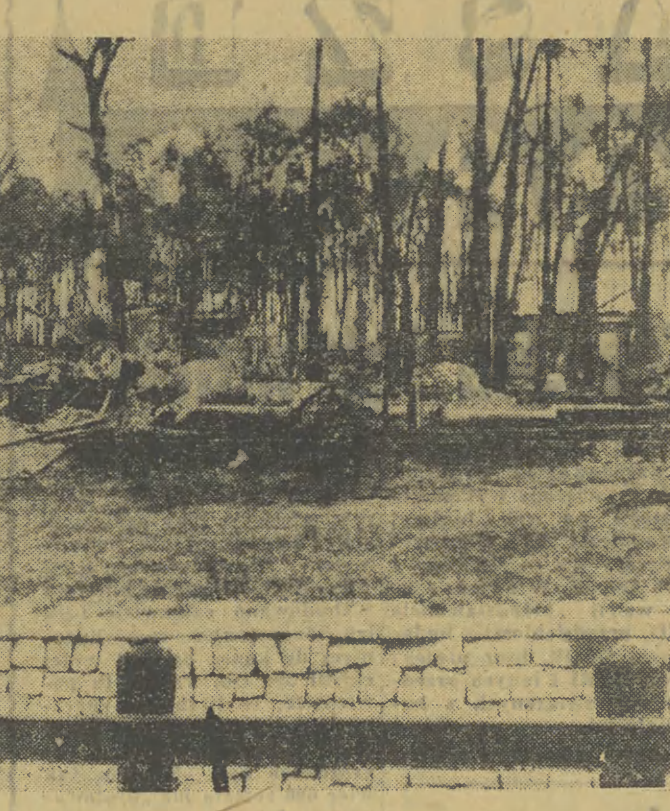
Dwa historyczne zdjęcia z Wybrzeża. U góry — Westerplatte po kapitulacji. U dołu — budynek Poczty Polskiej w Gdańsku — na moment przed wyjściem jej bohaterów.

14 WRZEŚNIA. — Armia „Łódź” pod dowództwem gen. Thomme przeszła Wisłę pod Modlinem. Po raz ostatni lotnictwo polskie bombarduje ugrupowania niemieckie w rejonie Jaworowa.