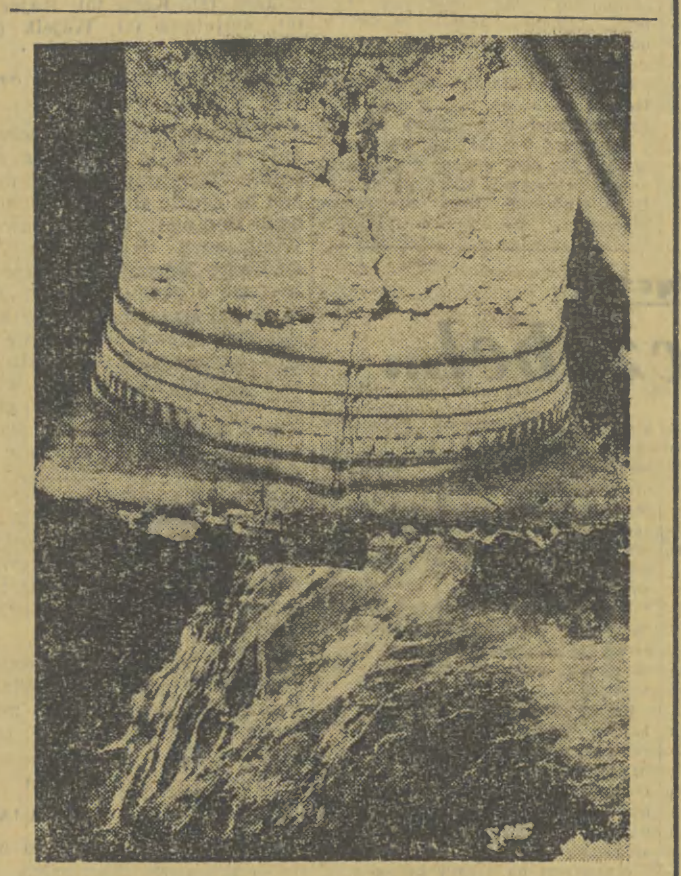
ZE ŚWIATA Między Nassereth, a Imst (NRF) obsunęła się skalna ściana 100-metrowej wysokości zasypując szosę, biegnącą z Garmisch — Partenkirchen do Szwajcarii i Włoch. Obsunięcie tej ziemi zniszczyło również piec wapienny.

„Jedną stronę poświęconą wyłącznie Nowej Hucie. Problematyka tej dziel-