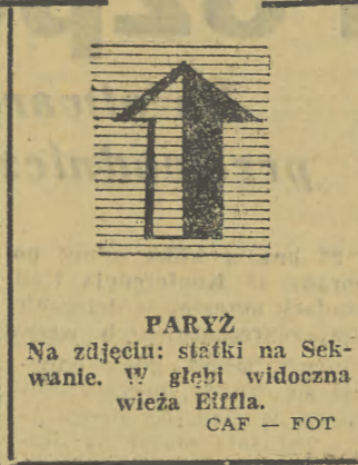
PARYŻ Na zdjęciu: wieża w Sekwanie. W głębi widoczna wieża Eiffla.

26 bm. na praskim lotnisku w Ruzynie wylądował samolot odrzutowy czeskosłowackich linii lotn. „Tu-104-a” po dokonaniu pierwszego lotu na linię Praga — Kair — Bombaj — Kair — Praga. Samolotem tym powrócił do CSR delegacja czeskosłowackiego Ministerstwa Komunikacji z wiceministrem tego resortu na czele która prowadziła w Indiach rozmowy w sprawie pogłębienia współpracy w dziedzinie komunikacji lotniczej między oboma krajami.