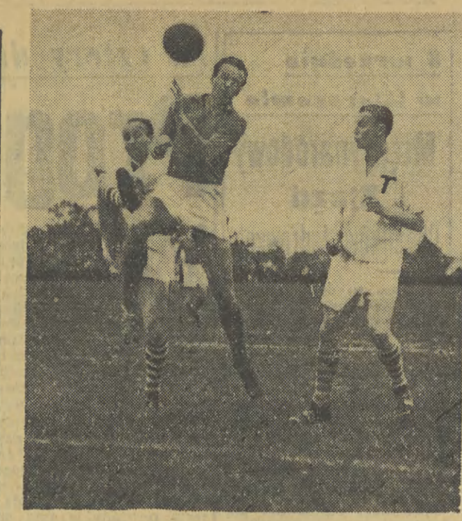
Rozgrywki krakowskiej ligi wojewódzkiej weszły w decydującą fazę. Każdy zdobyty punkt liczy się na wagę złota.